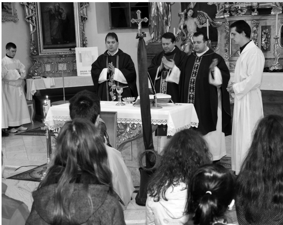
Počas mládežníckej svätej omše

pôjdu ku svojim kamarátom, tam, kde sa ani kňazi, ani iní nedostanú a tam budú svedčiť o Kristovi. Mnohých obdivujem. Nehanbia sa, neboja sa dávať svedectvo o Bohu spôsobom, ktorým to len oni vedia.