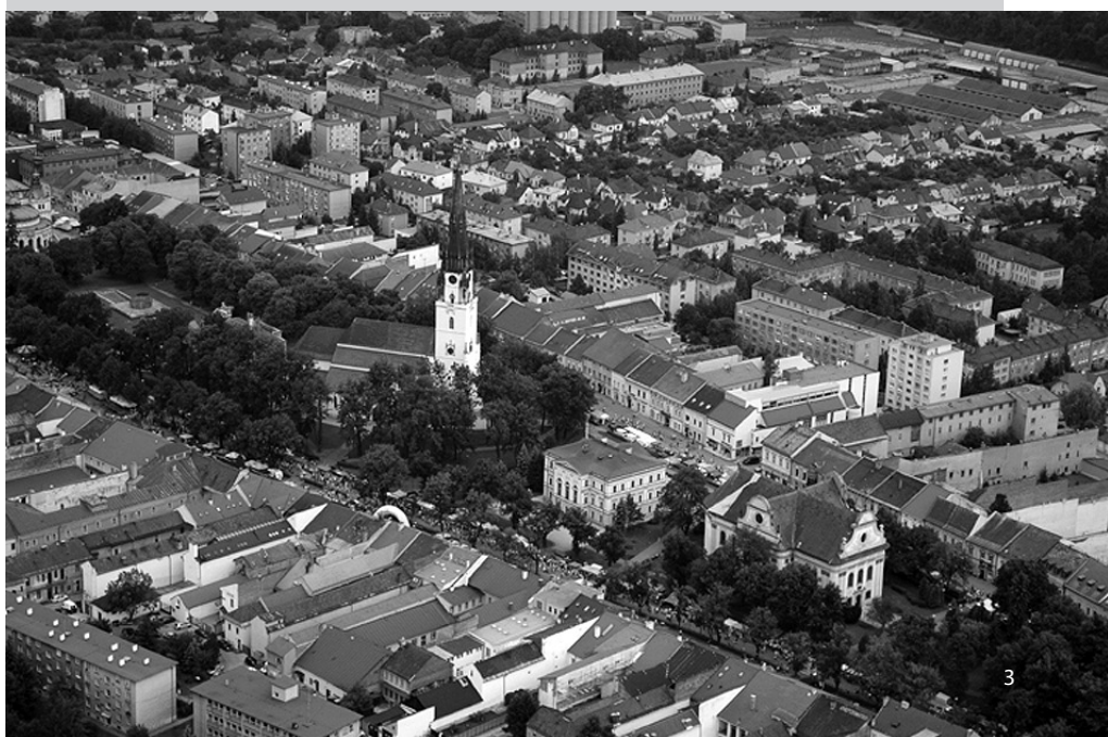
Pohľad na centrum farnosti zhora.