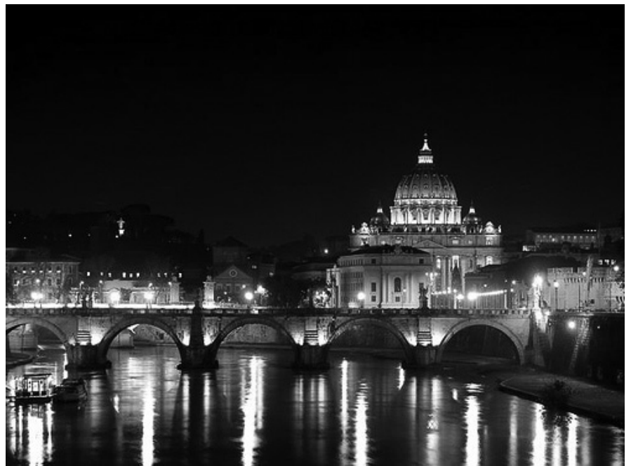
Pohľad na večerný Rím.

V dňoch 23.- 28. februára 2011 sa pri príležitosti 5. výročia vzniku Cirkevného gymnázia Štefana Mišíka v Spišskej Novej Vsi uskutočnila púť jeho študentov, učiteľov a veriacich do Ríma.