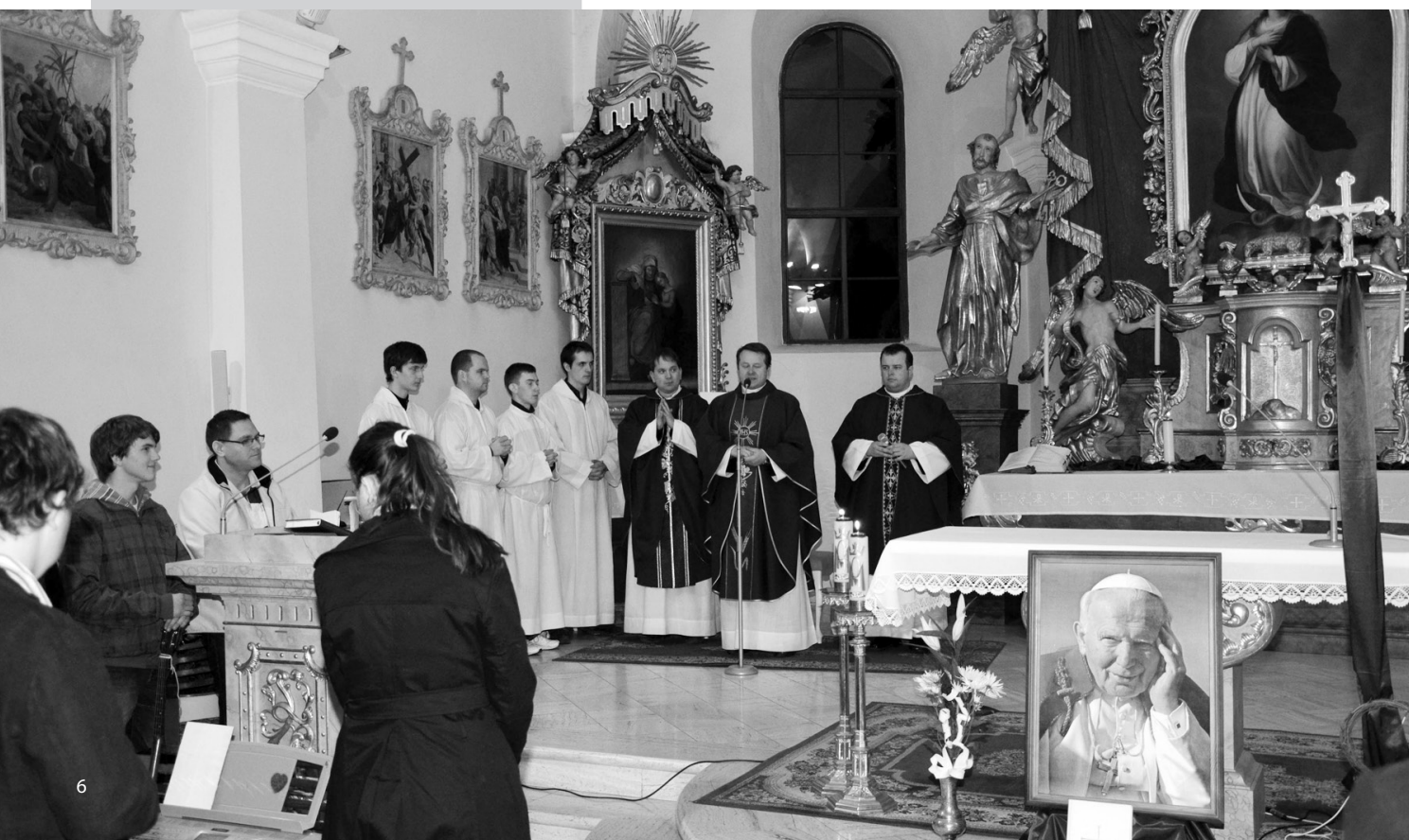
Svätá omša - Trojdnie k úcte bl. Jána Pavla II.

Keď som bol v Jablonke na Orave, každý rok sme chodili do Ríma na púť. Chlapcov a dievčatá som povzbudil, aby si zobrali so sebou kroj. Keď nás Svätý Otec videl oblečených v goralských krojoch, stále