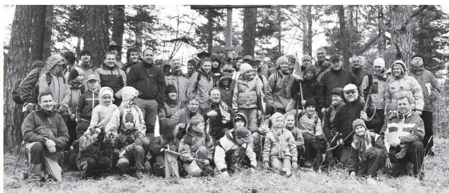
Účastníci krížovej cesty

Pôstne obdobie v skautskom podaní malo podobu krížovej cesty na Matku Božiu, tradičného výstupu spojeného s rozjímaním o veľkej Božej láske a obete. Ani nepriazeň počasie vo forme neutíchajúceho prudkého vetra neodradila osemdesiatku ľudí, aby sa jej 30. marca 2012 zúčastnili. Spoločný výstup začal modlitbou a nájdením kameňa, ktorý si každý sám nie-