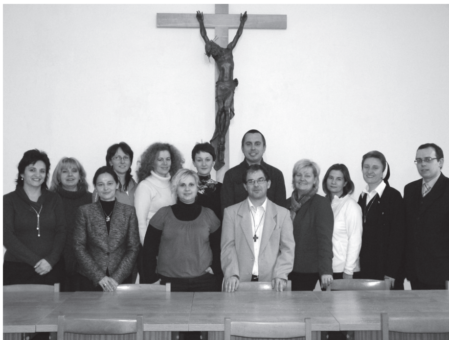
Absolventi funkčného vzdelávania

V rámci Komisie pre katechizáciu a školstvo Konferencie biskupov Slovenska centrum spolupracuje s jednotlivými diecéznymi katechetickými úradmi. Už