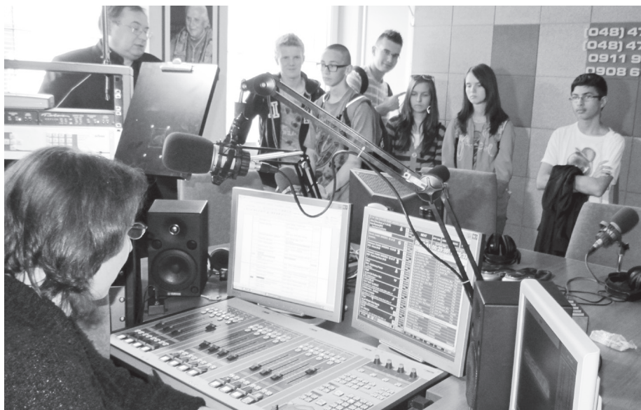
Exkurzia v Rádiu Lumen

Rodičia majú možnosť výrazne ovplyvniť, či predmet bude zaradený