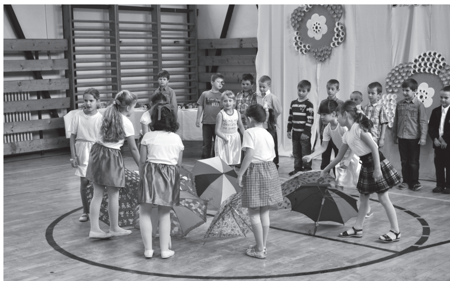
Hráme sa s angličtinou

Druhú májovú nedeľu majú sviatok naše mamky. Pri tejto príležitosti sme dňa 15. mája 2012 pre nich pripravili krátky program v telocvični školy. Deti sa predstavili tancom, spevom, hrou na hudobných nástrojoch i pásmom básní. O dôležitosti pomoci mamkám nás presvedčili štvrtáci v krátkej scéne prepletenej ľudovými tancami. Na záver nechýbali darčekom a spoločné agapé v jedálni školy. Milé naše mamičky, za všetko ešte raz ĎAKUJEME!