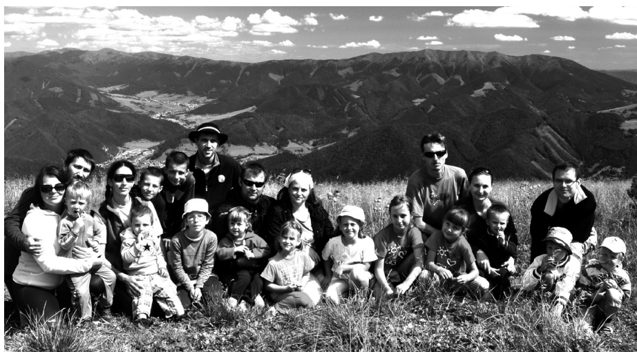
eRko dovolenka vo Veľkej Fatre

Teší nás, že dvaja žiaci deviateho ročníka ZŠ sv. Cyrila a Metoda v Spišskej Novej Vsi získali Goethe-Zertifikat A2 a Goethe-Zerifikat B1 Spoločného Európskeho rámca pre jazyky. Nemecké jazykové skúšky sa uskutočnili v Košiciach v dňoch 30. júna 2012 a 7. júla 2012 v spolupráci s Goetheho inštitútom.