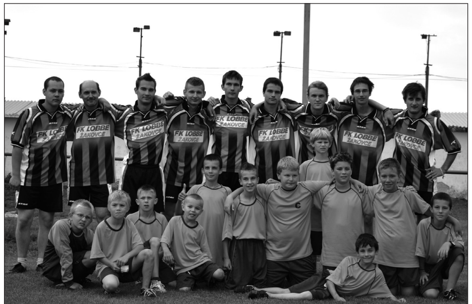
Naši miništranti - futbalisti