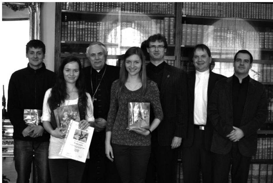
Biblická olympiáda – úspešní reprezentanti

Úlohou biblickej olympiády je podnietiť žiakov k štúdiu Biblie a na základe biblických príbehov pochopiť odkazy Božieho slova pre náš každodenný život. Súťaž bola pre nás povzbudením pravidelne čítať Sväté Písmo a rozjímať o ňom. Už teraz sa tešíme na prehĺbenie vedomostí z kníh, určených na najbližšiu biblickú olympiádu.