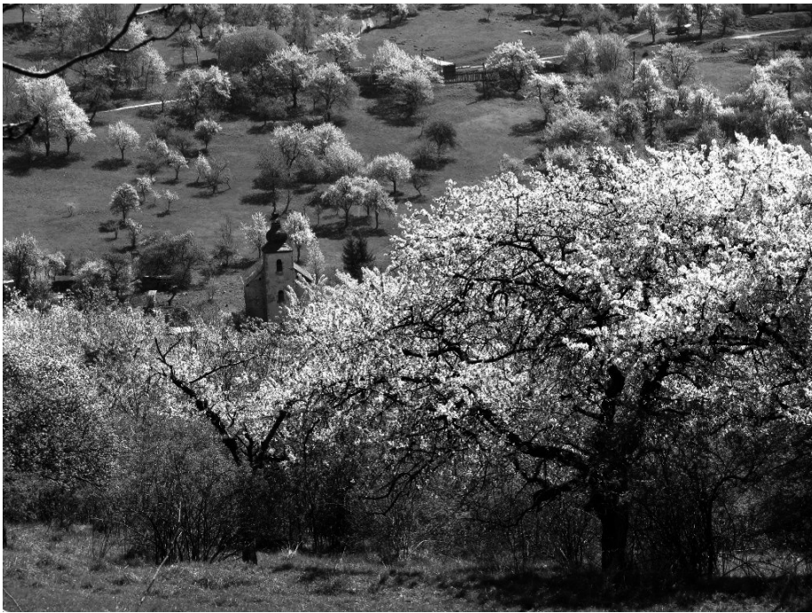
Vítazná fotografia – Braňo Endel, Čerešňové údolie

zberu, staré pneumatiky, plasty, matrace, linoleá. Na dôvažok, súdiac podľa stavu okolia, priestor slúži asi aj na združovanie asociálnych živlov. Nazbierali spolu dvanásť vriec odpadkov.