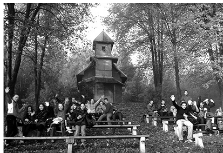
Akcia 72 hodín – žiaci zo ZŠ sv. Cyrila a Metoda pri kaplnke v Schulerlochu