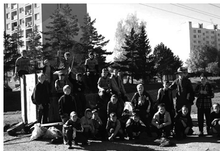
Skautíci počas akcie 72 hodín

V mesiaci október v čase od 19. do 21. 10. 2012 prebiehal celoslovenský trojdňový maratón dobrovoľníctva s názvom 72 hodín. Z našej farnosti sa do neho zapojili žiaci Základnej školy sv. Cyrila a Metoda a skupinka skautov.