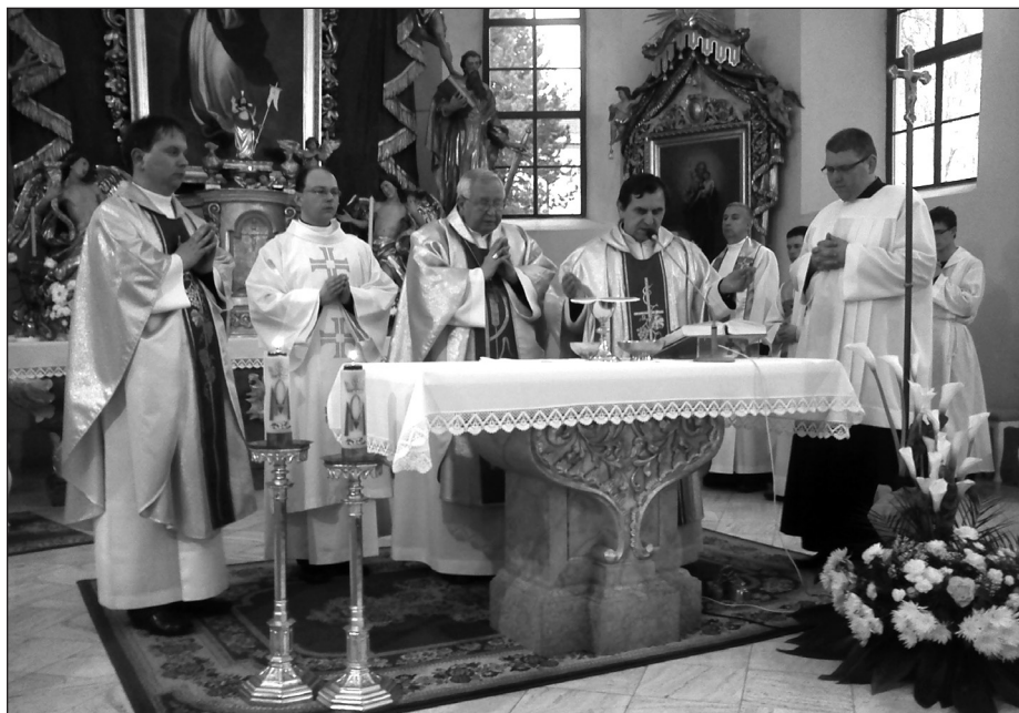
Ďakovná svätá omša pri príležitosti 20. výročia obnovenia Katolíckej jednoty v Spišskej Novej Vsi

Veríme, že náš Pán nám dá i naďalej milosť otvoriť srdcia k vzájomnej láske, jednote a oslobodí naše ruky pre konanie dobra. ■