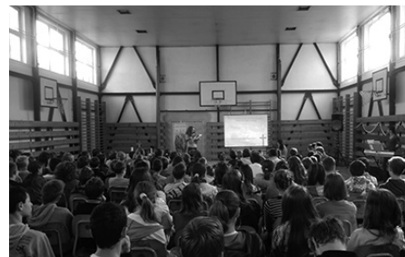
Akadémia o sv. Cyrilovi a Metodovi

Pápež Benedikt XVI. vyhlásil obdobie od 11. októbra 2012 do 24. novembra 2013 za Rok viery. V roku 2013 si zároveň budeme pripomínať 1150. výročie príchodu sv. Cyrila a Metoda na Veľkú Moravu.