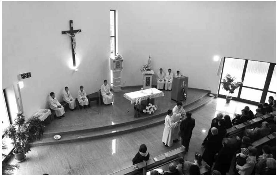
Prvá svätá omša v novom kostole na Ferčekovciach