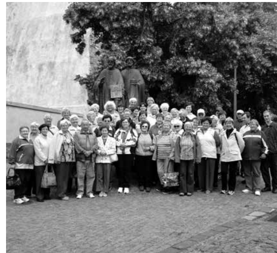
Pútnici v Nitre

Hlavným cieľom púte bola prehliadka Nitrianskeho hradu, Katedrály sv. Emeráma, návšteva diecézneho múzea, obhliadka morového stĺpa z roku 1750 i bronzového súsošia solúnskych bratov sv. Konštantína - Cyrila a Metoda z roku 1990. V Kostole Na-