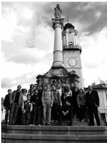
Žiaci v Banskej Bystrici