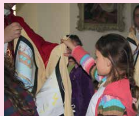
Detská sv. omša