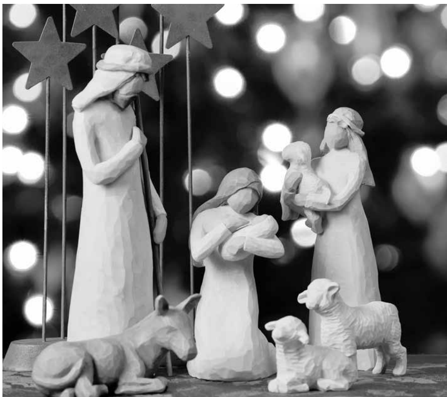
Znázornenie zrodenia.

Prežívanie Vianoc je spojené so spomienkami a sentimentom. Ale stále bude platiť, že Vianoce prinášajú posolstvo, ktoré sa oplatí znovu pripomínať. Hovorí o našom Bohu, ktorý sa rozhodol darovať nám samého seba v plnosti. Svedčia o Bohu, ktorý sa rozhodol byť nám veľmi blízko a podstúpiť pritom všetky ľudské obmedzenia. Stvoriteľ to nespravil náhodou. Chcel láskou premôcť, čo my nedokážeme: hriech a smrť. Preto sa Boh stal človekom, narodil sa a žil medzi nami viac ako tridsať rokov, aby dovŕšil svoje