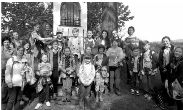
Misijná púť detí

V sobotu 13. mája 2017 sme si pripomenuli 100 rokov od zjavenia Panny Márie vo Fatime.