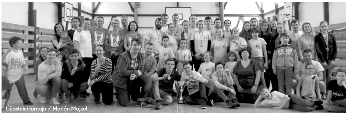
Účastníci turnaja / Marián Majzel

Opäť po roku sa priaznivci športu našej farnosti stretli v sobotu 13. mája 2017 na pôde ZŠ sv. Cyrila a Metoda v Spišskej Novej Vsi, aby si nielen zmerali sily a porovnali svoje schopnosti, ale hlavne si zašportovali.