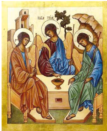
Trojica

Pamätáte sa, ako znela prvá veľa, ktorú položil diabol Ježišovi pri pokúšaní na púšti? Začalo to týmito slovami: „Ak si Boží Syn...“ Nevie, akú máte skúsenosť vy, ale