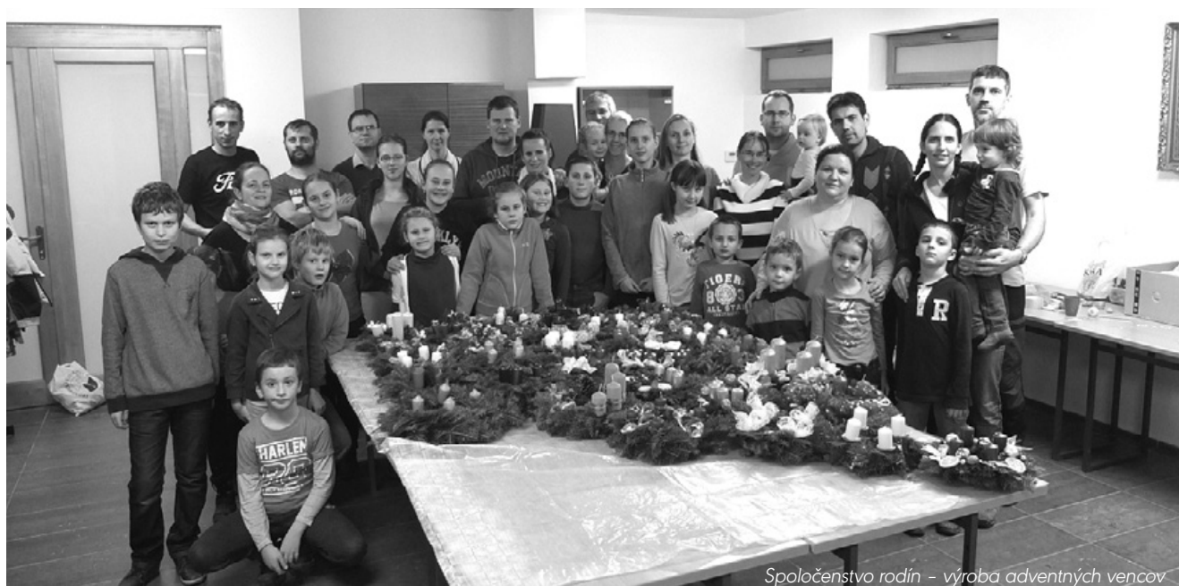
Spoločnosť rodín - výroba adventných vencov