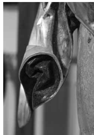
Drapéria Ukrižovaného poskladaná do typického znaku Majstra Pavla na sochách má tvar ucha | Miloš Fil'a