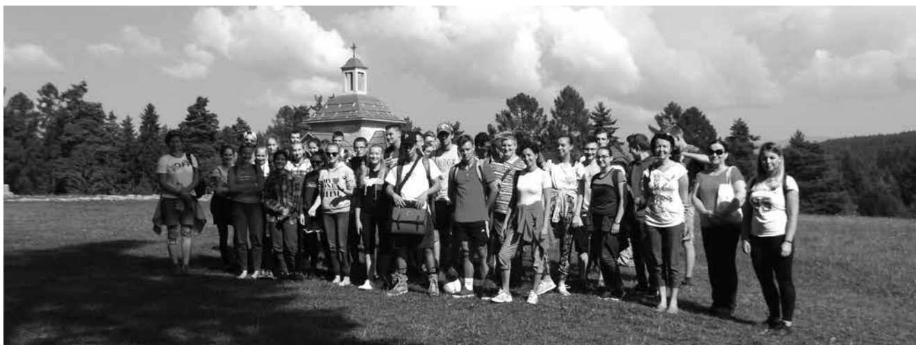
Žiaci spolu s učiteľmi na účelovom cvičení