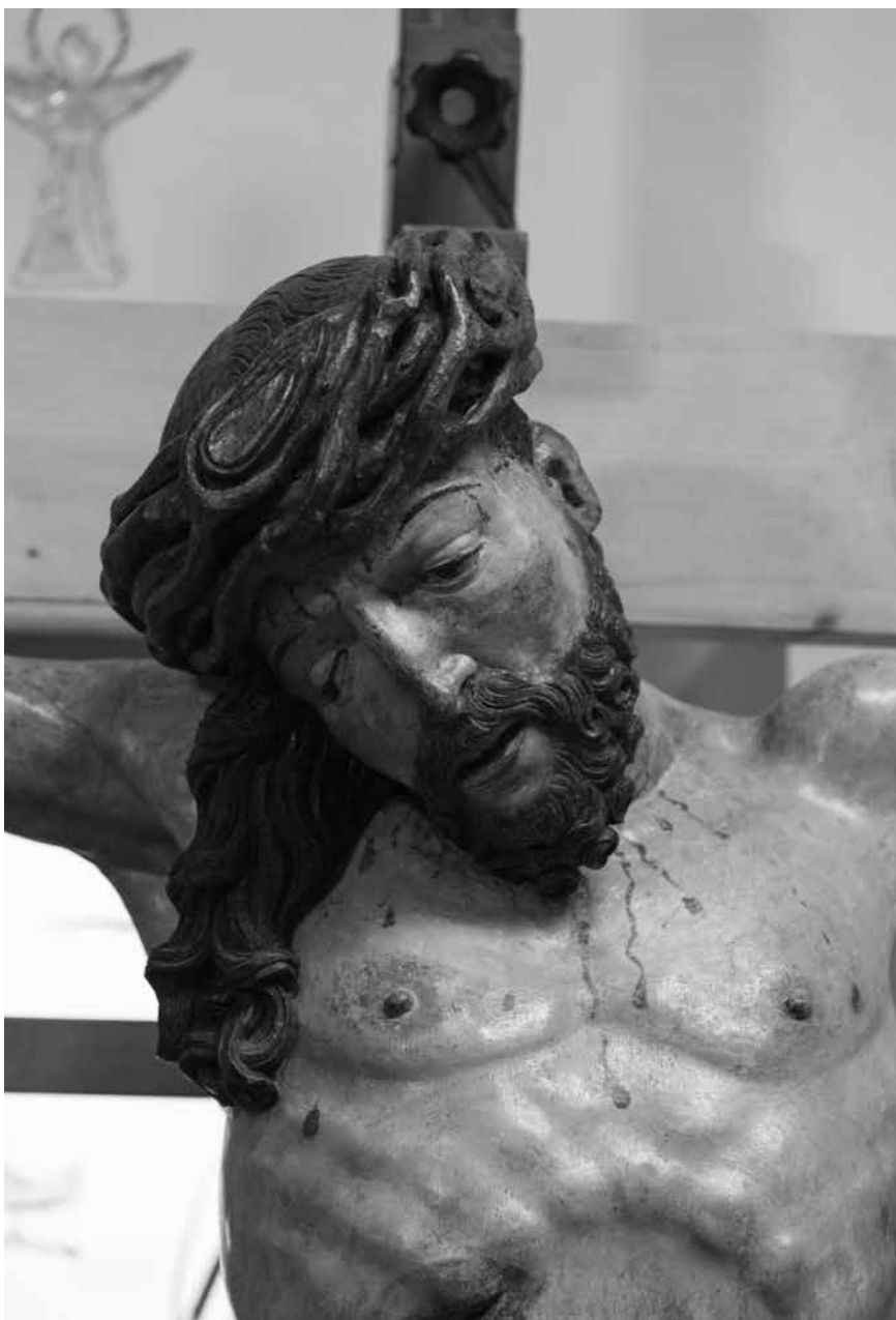
Pohľad na Ukrižovaného z Kalvárie – typickým znakom sôch Majstra Pavla sú mandľové oči | Miloš Fiľa

zu. Zistilo sa, že socha Krista je pomerne dobre zachovaná, v horšom stave boli sochy pri kríži. Ďalej sa zisťovali vrstvy, ktoré boli nanesené na drevo sôch v priebehu dejín. Postupne sa odstraňovali nové vrstvy, až sa reštaurátori dostali na pôvodnú, najstaršiu vrstvu. Ako skonštatoval majster Siváň, najvýznamnejším aspektom reštaurovania bolo práve ob-