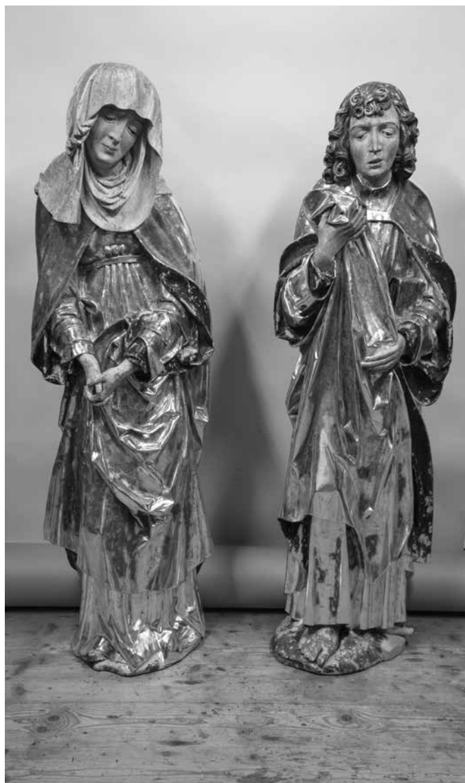
Sochy Panny Márie a sv. Jána z Kalvárie