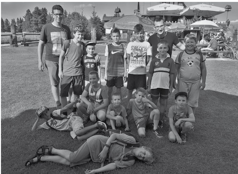
Miništranti na chate

Na tomto pobyte v krásnej prírode Slovenského raja sme tak mohli načerpať niečo pre dušu, ale aj pre telo. Ďakujeme všetkým, ktorí sa podieľali na príprave a priebehu tejto vydarenej letnej akcie. •