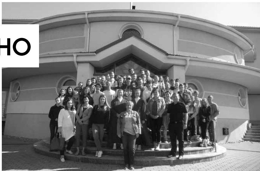
Žiaci na návšteve v kláštore u sestier redemptoristiek v Kežmarku