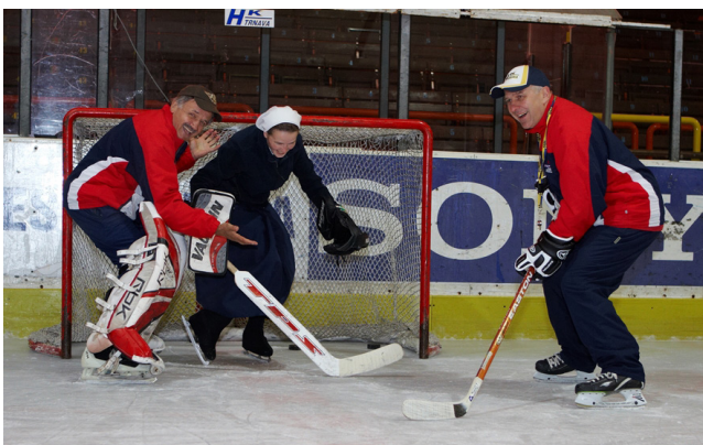
Pokus o osvojenie si brankárskeho majstrovstva pod vedením odborníkov Glenna „Chico“ Rescha a Mika Gartnera

Za rozhovor úprimne ďakujeme a vyprosujeme veľa Božieho požehnania. •