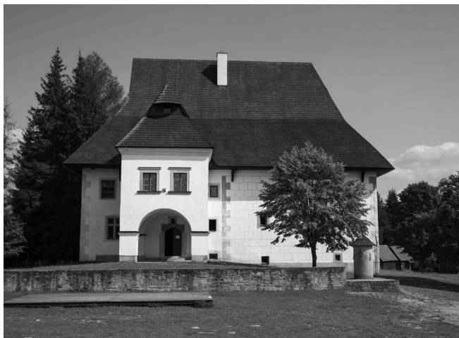
Skanzen Pribilina – kaštieľ

zo života Majstra Pavla z Levoče v jeho dome.