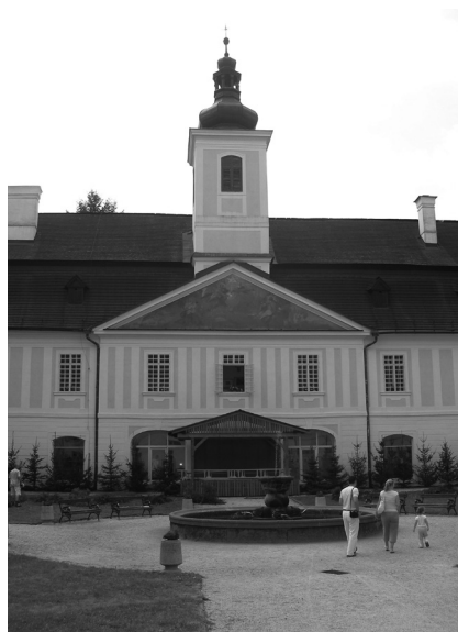
Sv. Anton - kaštieľ

Našu pomyslenú prechádzku slovenskými múzeami začneme v Modrom Kameni, kde môžeme navštíviť Múzeum bábkarských