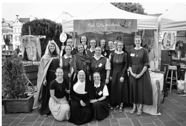
So spolusestrami z EXPO povolání na stretnutí mládeže P18 v Prešove