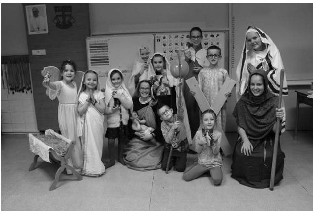
eRko krúžok - Centrum voľného času v ZŠ a MŠ Angely Merici v Trnave

Na niektoré z nich si nepamätám, ale považujem ich za veľmi dôležité: fakt, že ma rodičia chceli a prijali do svojho života ako dar od Boha, že ma s láskou vychovávali a priviedli k nemu; obdobie môjho obrátenia počas štúdia na vysokej škole a život s mladými v našom farskom spoločenstve, ktorí mi boli príkladom a povzbudením, ako aj možnosť spievať v našom chrámovom zbore, kedy sa Pán dotýkal môjho srdca a zažívala som „predchuť neba“ už tu na zemi; rozhodnutie byť a žiť s ním ako jeho nevesta v rehoľnom spôsobe života a každé na-