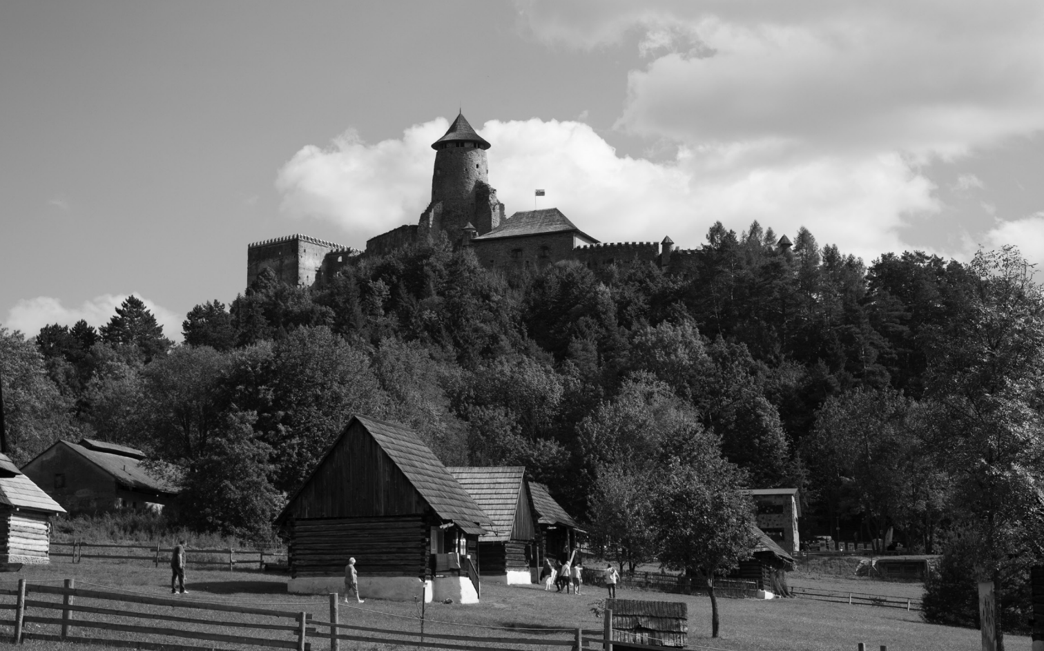
Skanzen Stará Ľubovňa v pozadí s Ľubovnianskym hradom

c) známky a známková tvorba – tá obsahuje vyše 6,5 milióna zbierkových predmetov. Vo fonde sú československé známky z rokov 1918 – 1992.