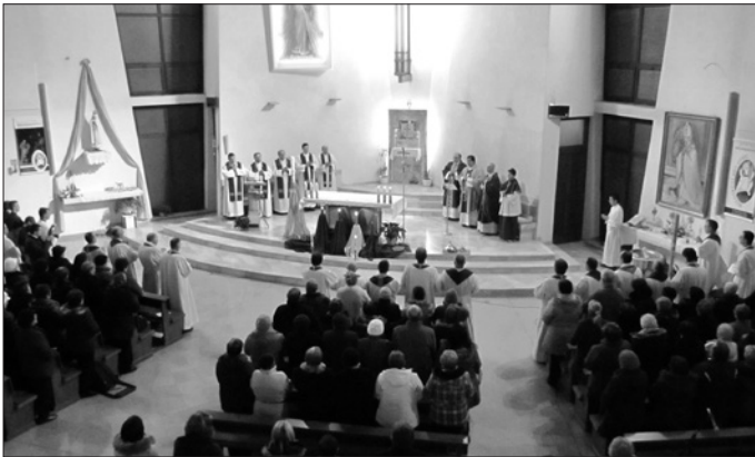
Dekanátna púť do Svätyně Božieho milosrdenstva

Pápež František 8. decembra 2015 otvorením jubilejnej brány slávnostne zahájil v Cirkvi mimoriadny Rok milosrdenstva.