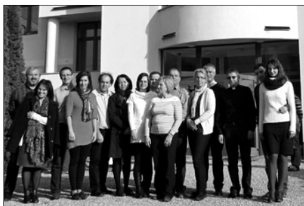
Manželia počas formačného víkendu

V dňoch 24. – 25. októbra 2015 sa v Smižanoch uskutočnil formačný víkend pre manželov z našej farnosti, ktorí sa budú podieľať na príprave snúbencov k prijatiu sviatosti manželstva v dekanáte Spišská Nová Ves.