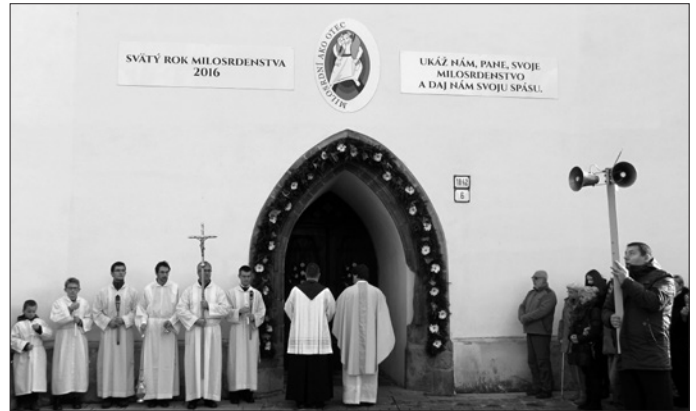
Otvorenie Brány milosrdenstva vo Farskom kostole

V sobotu 12. decembra 2015 sa vo Svätyni Božieho milosrdenstva v Smižanoch pri príležitosti Roku milosrdenstva uskutočnila dekanátna púť k Božiemu milosrdenstvu.