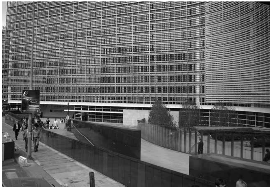
Brusel – parlament

V roku 2007 bola zmluva upravená, inovovaná - tzv. Lisabonská zmluva, ktorá je platná od roku 2009.