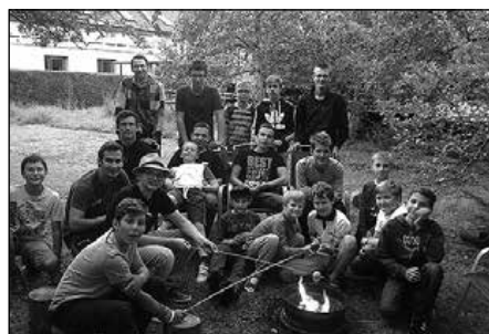
Opekačka na farskom dvore

Každý miništrant svojou službou napomáha kňazovi pri slávení liturgie. Miništrovanie je privilegiom – je to služba plná zodpovednosti, ale aj dobrodružstva. Za každú aktívnu službu vo farnosti sme veľmi vďační. Na fotografii je spoločná opekačka miništrantov, ktorá sa konala cez letné prázdniny v záhrade Farského úradu. Aj takýmto spôsobom sa posilňujú dôležité hodnoty, akými sú obeta, vytrvalosť, priateľstvo, solidarita. Všetko na oslavu Boha! ■