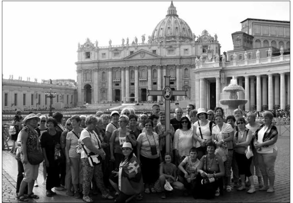
Spišskonovoveskí pútnici na Námestí sv. Petra

Zvlášť chcem spomenúť hlboké duchovné zážitky pri uctení relikvií svätých Petra, Pavla, Kataríny Sienskej, svätého Cyrila, obrazu Matky ustavičnej pomoci, či stretnutie s pápežom Františkom na generálnej audiencii, alebo pri pokľaknutí pred jasličkami, v ktorých bol uložený náš Spasiteľ, či pri klačaní na Svätých schodoch. Určite si