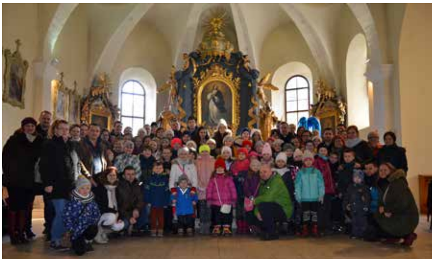
Spevácky zbor Svetlušky

Pieseň, ktorú Svetlušky spievali na ďakovnej sv. omši končí trojhlasnou ozvenou... a do svetla svojo voved... chceme našim spevom a službou vstupovať do svetla Pána a byť svetlom pre druhých. •