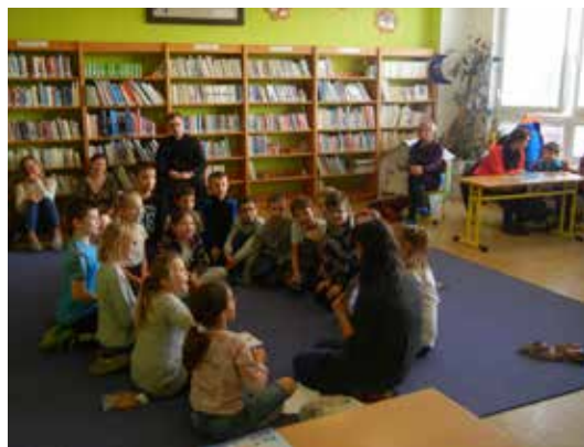
Deň otvorených dverí