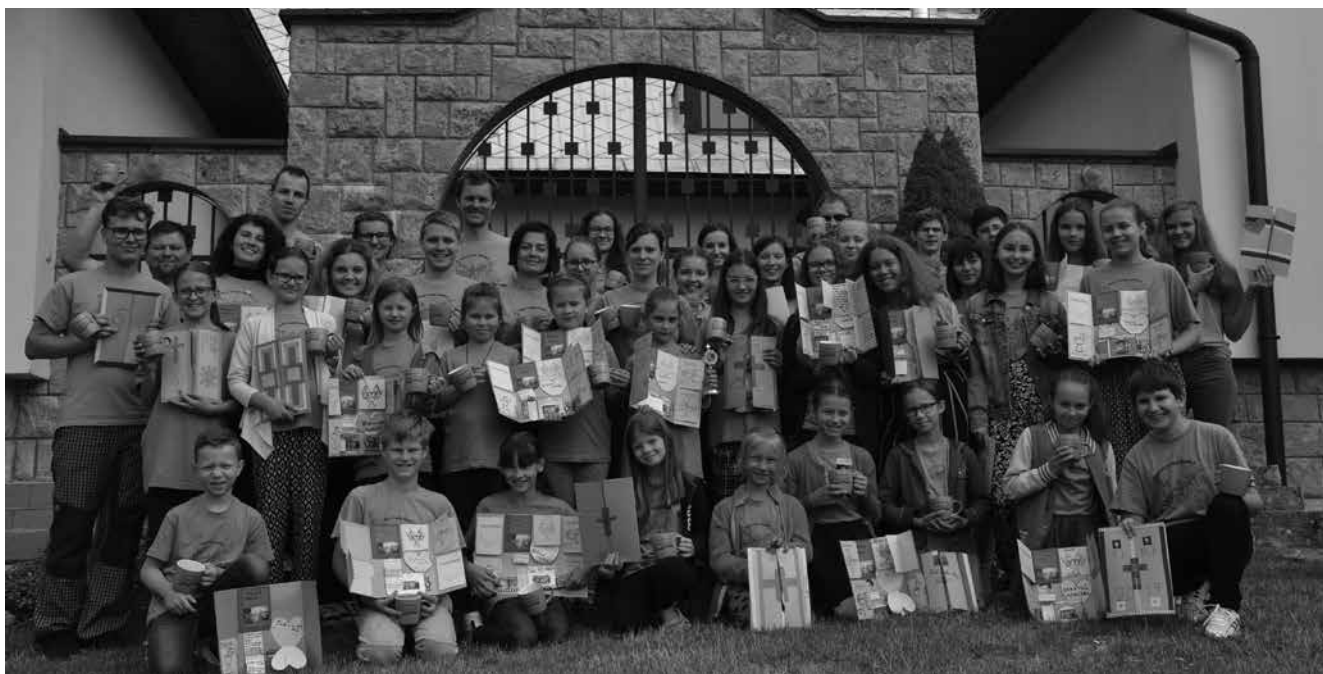
Svetlušky na sústredení