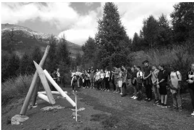
Návšteva Starého Smokovca