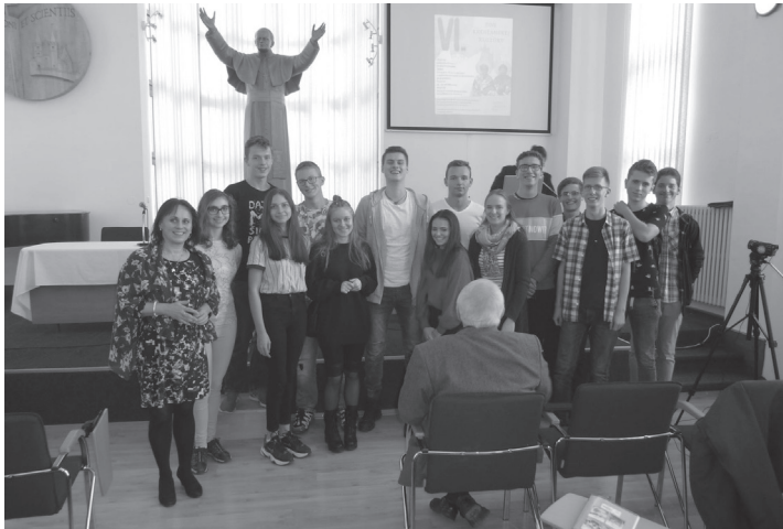
Dni kresťanskej kultúry

V októbri sme sa zapojili aj do medzinárodnej aktivity Milión detí sa modlí ruženec , v aule školy sme sa modlili ruženec svetla po slovensky, anglicky, nemecky, taliansky a latinsky za misie na celom svete.