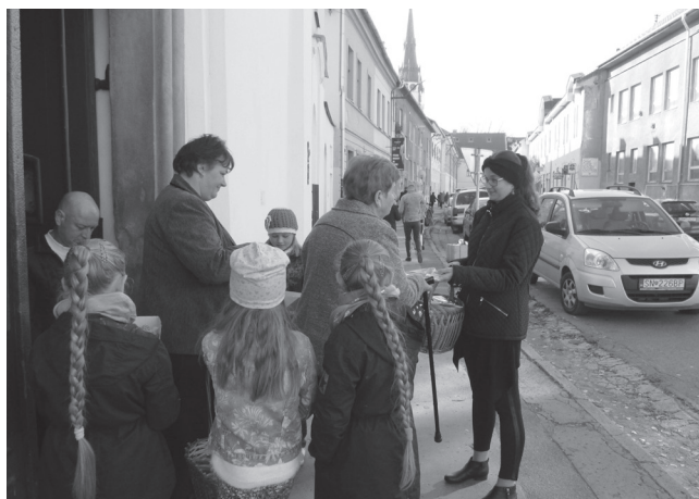
Aktivity mimoriadneho misijného mesiaca október 2019