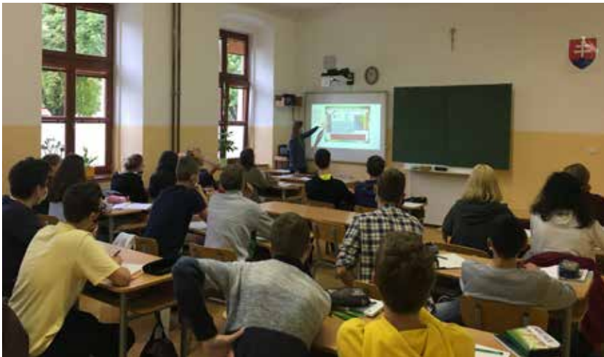
Prezenčná výučba na gymnáziu

Mojou najväčšou túžbou je, aby sa naše gymnázium stalo prvou voľbou pre kresťanského rodiča pri rozhodovaní, kam umiestniť svoje dieťa po skončení ZŠ. Aby sa žiak ani rodič nerozhodoval na základe nepodložených a nepravdivých názorov, ktoré sa bohužiaľ niekedy objavujú, a s ktorými je veľmi ťažké bojovať a vyvracať ich.