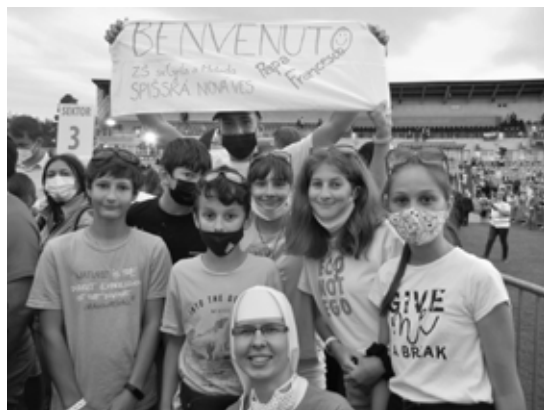
Stretnutie so Sv. Otcom

pritom chodiť ďaleko. Stačí prinášať lásku vo svojom okolí.