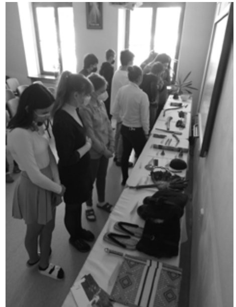
Výstava suvenírov z misí