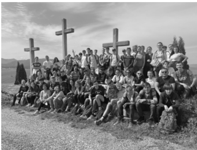
Duchovná obnova na smižianskej Kalvárii