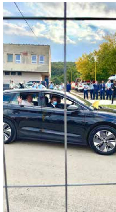
Pápež František na Luníku IX v Košiciach