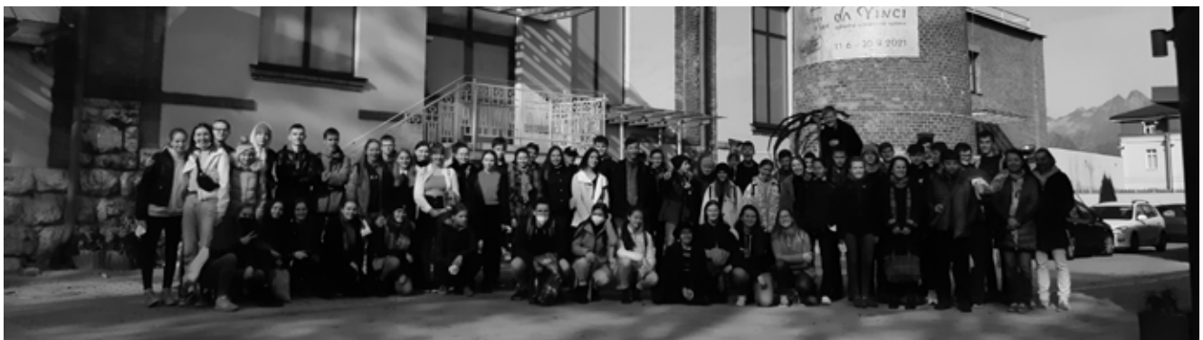
Zážitkové vyučovanie v Poprade