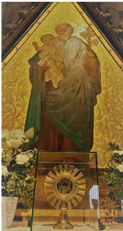
Sv. Jozef - relikvia