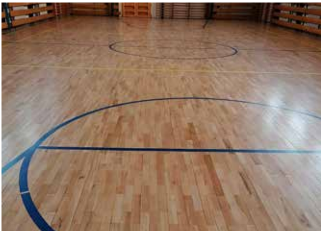
Nová palubovka v telocvični

Národný projekt Pomáhajúce profesie v edukácii detí a žiakov nám umožnil v termíne od 1.3. 2021 do 31. 8. 2022 vytvoriť na škole inkluzívny tím: špeciálny pedagóg, sociálny pedagóg, 2 pedagogickí asistenti, ktorí v spolupráci s triednymi učiteľmi a rodičmi budú pracovať so žiakmi so špeciálnymi výchovno-vzdelávacími potrebami.