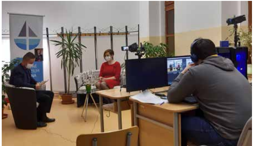
Školské televízne štúdio DOD