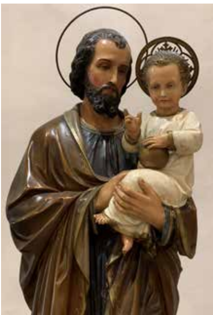
Sv. Jozef - pestún

vera a podpora v nich vypetuje pevnosť vyháňať sa nástrahám dneška. Potrebujú vedieť, že trpezlivosť a vytrvalosť vo viere prekoná skúšky, ktoré ich čakajú.