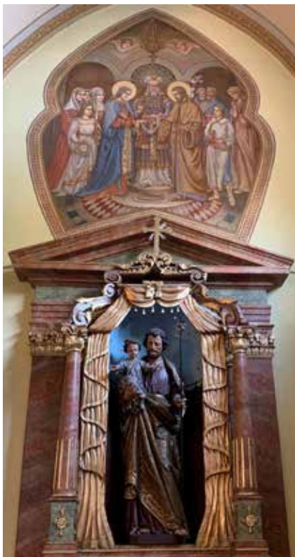
Sv. Jozef a Mária