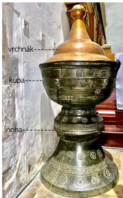
Krstiteľnica v Kostole Nanebovzatia Panny Márie v Sp. Novej Vsi