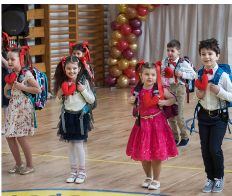
Oslavy 30. výročia školy