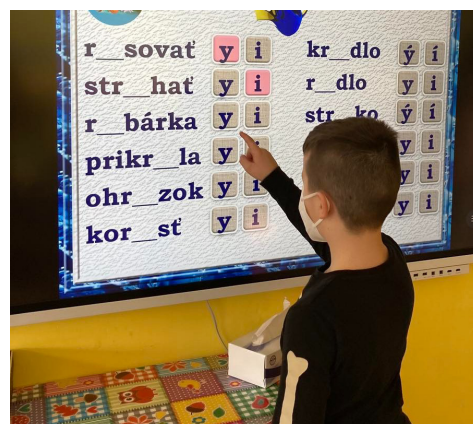
Práca s novou dotykovou tabuľou