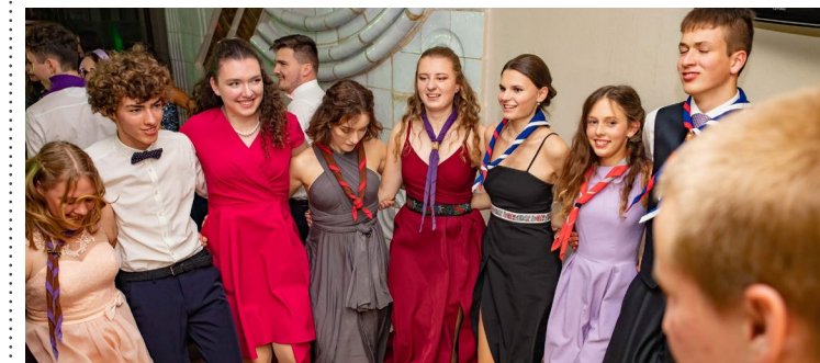
Skautský ples - radosť z jednoty