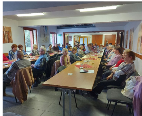
Stretnutie Katolíckej jednoty pri gulášoch

Na záver by bolo možné slová básnika parafrázovať a povedať, že „každý deň sa stávať človekom, ktorého je radosť stretnúť, to stačí” . Snažme sa o to.