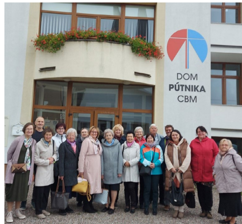
Celoslovenské stretnutie Katolíckej jednoty