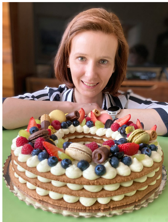
Medová torta a jej autorka

Kým nám upečené pláty budú chladnúť, pripravíme si náplň. Vo vodnom kúpeli rozpustíme čokoládu. Mascarpone, tvaroh, med a smotanu vyšľaháme do polotuha. Prilejeme vlažnú rozpusťenú čokoládu a rýchlo zašľaháme do tuha. Krémom naplníme cukrárske vrečko s hladkou špičkou. Malinovým džemom naplníme ďalšie vrečko (plastové) a urobíme v ňom malý otvor. Na spodný plát cesta, na vonkajší a vnútorný okraj, nanesieme ozdobne krém. Ostatný povrch plátu plníme striedavo džemom a krémom. Opatrne položíme druhý plát, jemne pritlačíme a postup zopakujeme. Ukončíme posledným plátom cesta a ozdobíme zvyšným krémom. Na vrch poukladáme čerstvé ovocie a pralinky alebo sušienky upečené zo zvyšného cesta. Aby medové pláty zmäkli a krém stuhol, tortu necháme odležať v chladničke, ideálne cez noc.