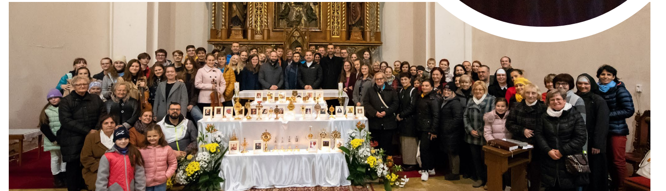
„Večer so svätými“ - 31. októbra 2022 vo Farskom kostole Nanebovzatia Panny Márie