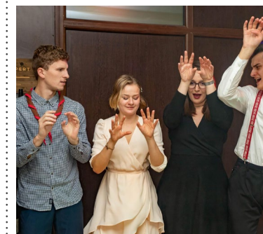
S radosťou skautov