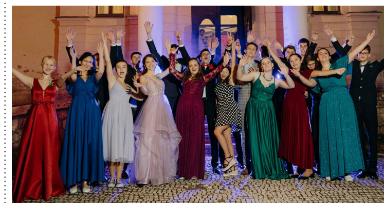
Maturanti Cirkevného gymnázia počas stužkovej slávnosti