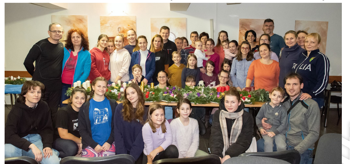
Spoločný čas rodín pri tvorení adventných vencov