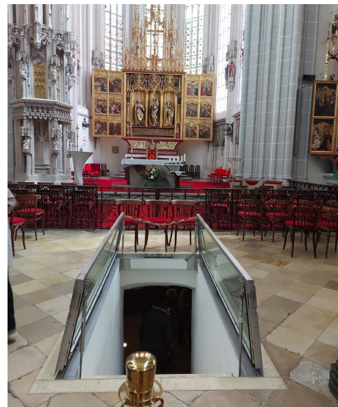
Vchod do krypty Dómu sv. Alžbety v Košiciach