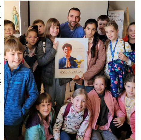
Duchovná obnova žiakov 5. ročníka