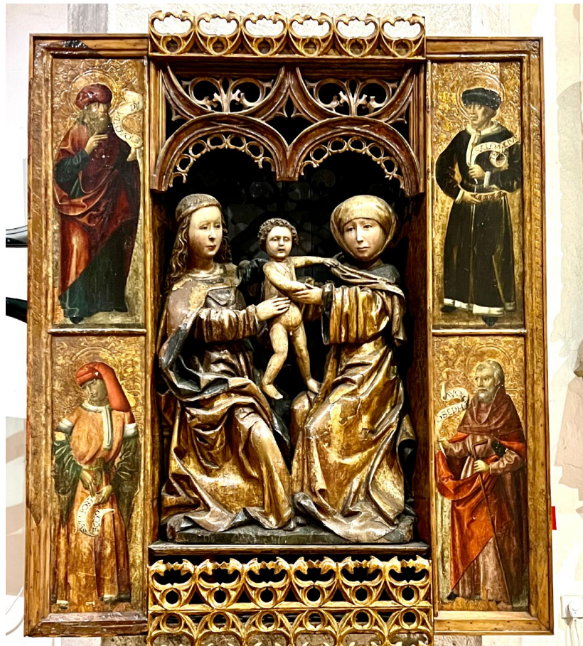
Oltár svätej Anny Samotretej (Metercia)

Kolektív autorov: Dejiny mesta Spišská Nová Ves, 2014