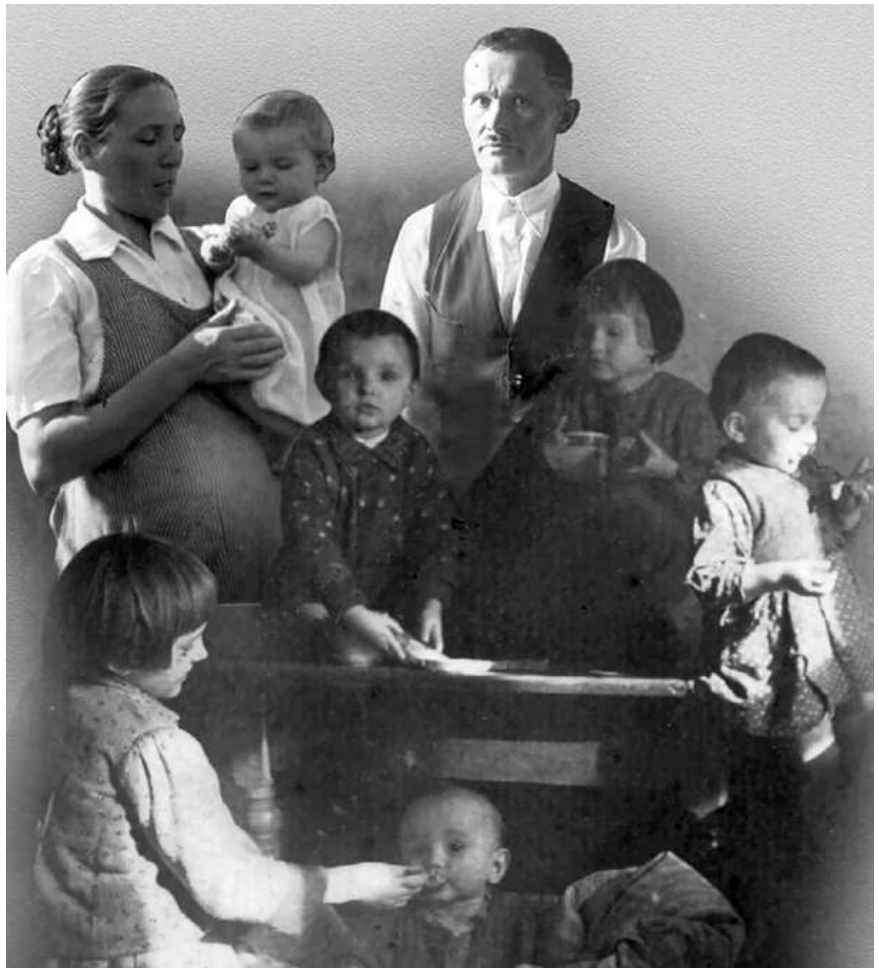
Rodina Ulmorcov – obraz.

V roku 1941 Nemci zaviedli na poľských územiach trest smrti za akúkoľvek pomoc Židom. Židom sa rozhodlo pomôcť viacero rodín z obce a ukryli ich vo svojich domoch. Najväčšiu skupinu Židov však prichýlila práve rodina Ulmorcov. Rodina