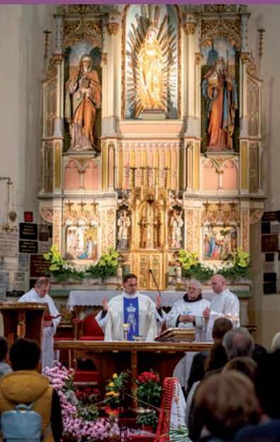
Svätá omša na Mariánskej hore.