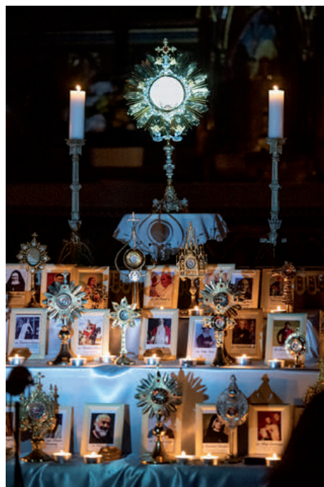
Svätí uprostred nás