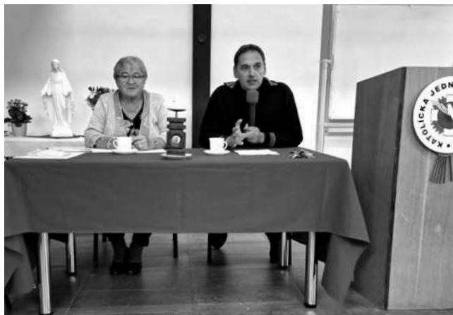
Počas stretnutia Katolíckej jednoty.

Dňa 9. októbra 2023 sa na Mariánskej hore v Levoči konala púť Katolíckej jednoty za kňazov .