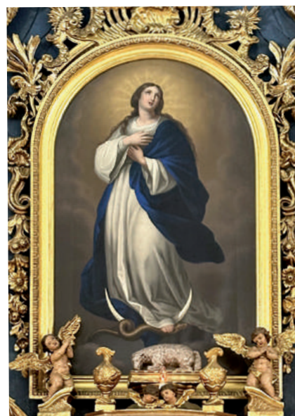
Obr. 3 – Neznámy autor: Immaculata 1856, Malý kostol, Spišská Nová Ves