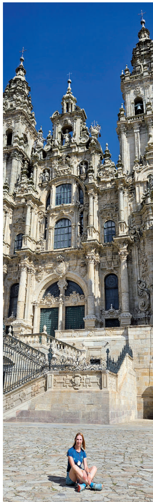
Santiago de Compostela – cieľ putovania.

Ďakujeme a Pán Boh nech vypočuje tvoje pranie.