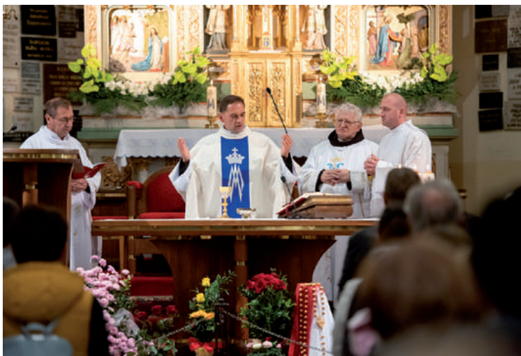
Farská púť na Mariánsku horu v Levoči.