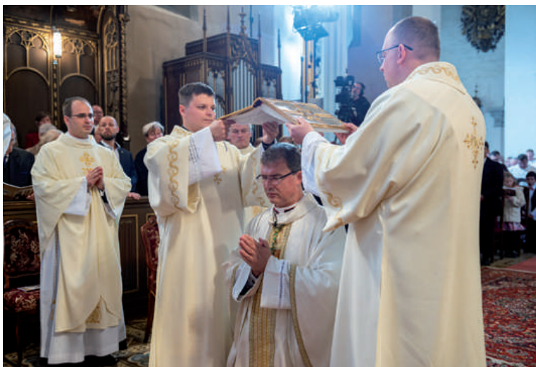
Vysviacka nového spišského biskupa.