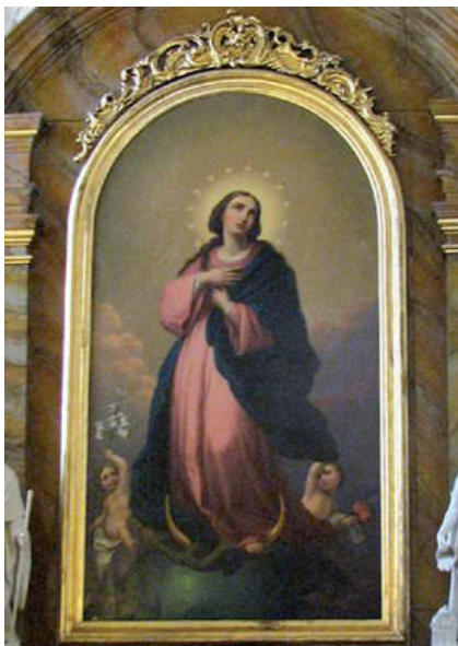
Obr. 2 – J. B. Klemens: Immaculata 1856, Žilina