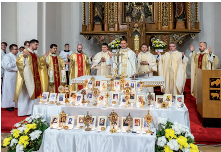
Vigília Sviatku všetkých svätých.