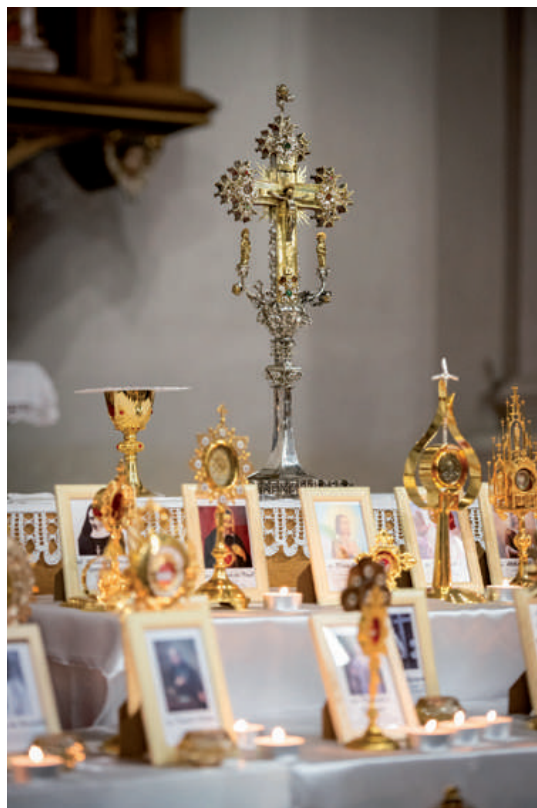
Relikviáre svätých.