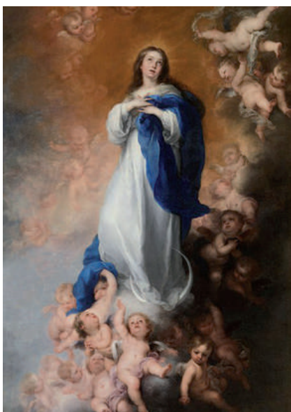
Obr. 1 – B. E. Murillo: Immaculata 1678, Madrid

Kráľovná počatá bez poškvryni dedičného hriechu, orodu za nás!