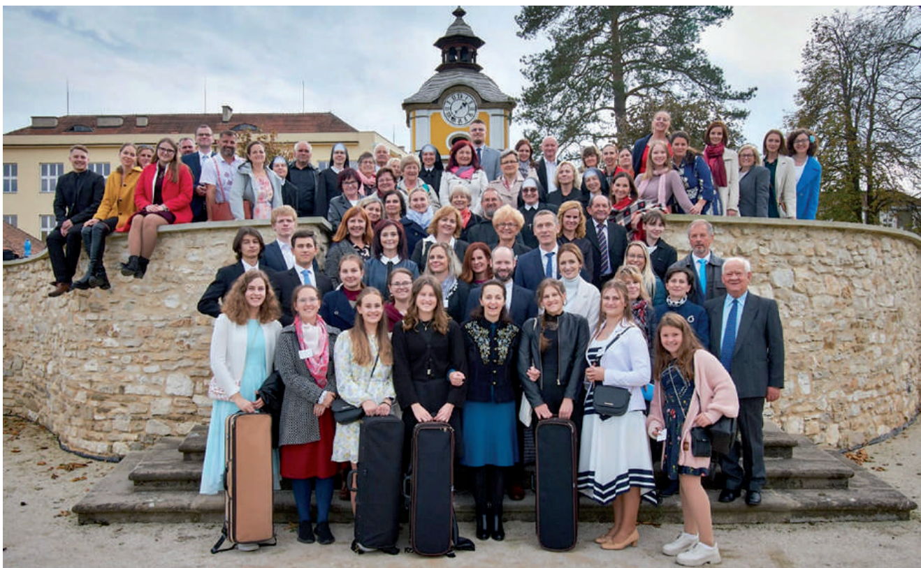
Náš farský zbor na biskupskej vysviacke.