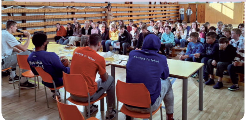
Beseda so Spišskými rytiermi.

Športovú atmosféru si naši žiaci vychutnali 2. novembra 2023, kedy našu školu navštívili basketbalisti „Spišskí rytieri“ . Sme radi, že sa naša telocvičňa mohla na pár hodín premeniť na miesto, v ktorom sme mohli zažiť neopakovateľné chvíle radosti, smiechu, diskusie, športových súťaží. Čerešničkou na torte bol zápas profesionálov s našimi žiakmi. Samozrejme, v závere nechýbala ani autogramiáda.