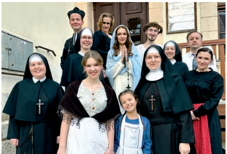
Herci a herečky z divadelnej hry Trp, mlč a modli sa...