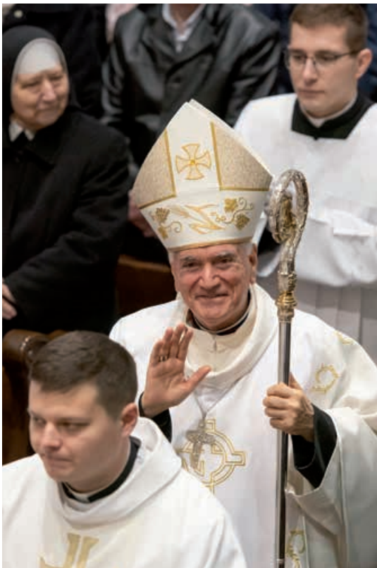
Apoštolský nuncijs Nicola Girasoli.