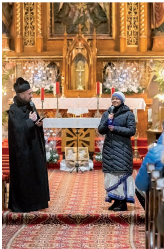
Beseda so sr. Phanielou.