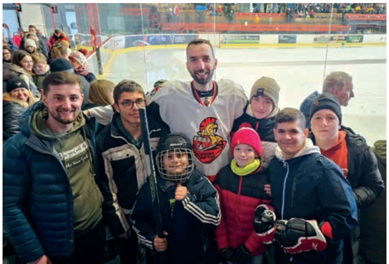
Hokejový turnaj kňazov a rehoľníkov.