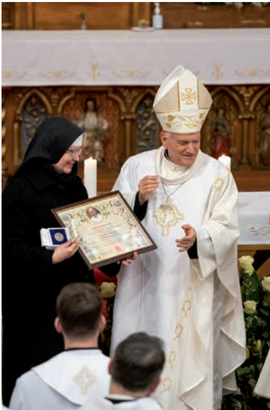
Odovzdanie darov od Sv. Otca Františka.