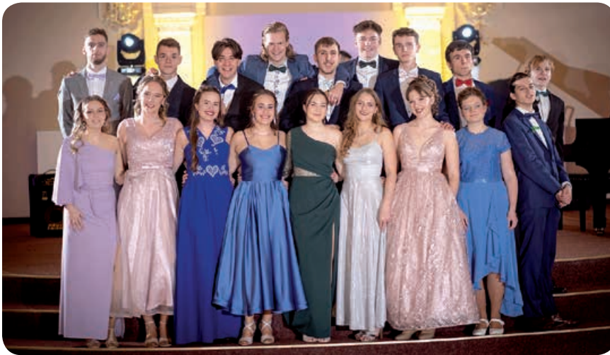
Reprezentačný ples Cirkevného gymnázia Štefana Mišíka