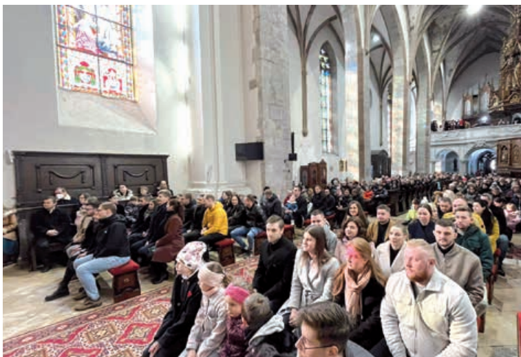
Obnova manželských sľubov.