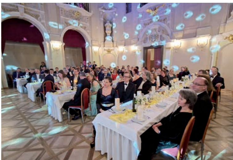
Farský ples.