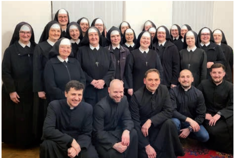
Deň zasvätených osôb.