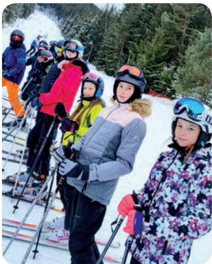
Siedmici na lyžiarskom výcviku

Začnime pekne od základu. V prvom ročníku sme zaviedli nové vyučovacie metódy . V matematike je to Hejného matematika , ktorá rozvíja žiaka komplexne. Učí ho kriticky myslieť, bádať a rozvíja jeho logiku i komunikačné zručnosti. Rovnako sa dieťa učí pracovať v tíme, poznáva silné a slabé stránky seba i svojich spolužiakov. V slovenskom jazyku metóda SFUMATO rozvíja u detí zážitok a radosť z čítania, podnecuje ich tvorivosť a chuť zdokonaľovať seba samého. Ak má dieťa vnútornú motiváciu k svojej činnosti, chce na sebe pracovať a vidí, že to má zmysel, prináša mu to uspokojenie a radosť.