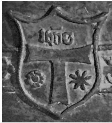
Erb antonitského preceptorátu, Spišské Vlachy, 1497

Antoniti mali dobrú organizáciu práce, zakladali kláštory a špitále a pre svoju užitočnosť sa veľmi rýchlo rozšírili po celej Európe, kde sa orientovali na pomoc chorým, ktorých postihlo pomerne rozšírené ochorenie, známe ako ergotizmus. Spôsobovala ho konzumácia chleba z obilnín napadnutých parazitickou hubou. Chorým pomáhali podávaním kvalitného chleba a vína zmiešaného s liečivými bylinami, tiež