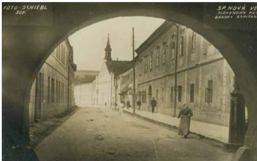
Levočská ulica – pohľad od Levočskej brány.

V našom meste sídlili v rokoch 1939 až 1950. Superiorom (predsta-