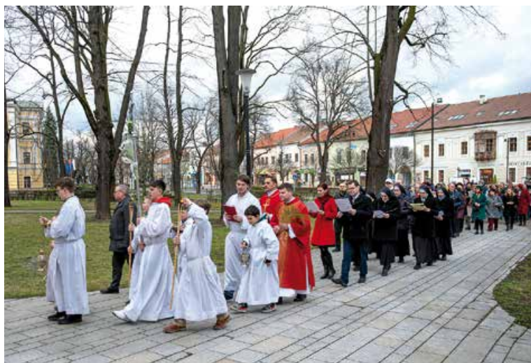
Sprievod na Kvetnú nedeľu.