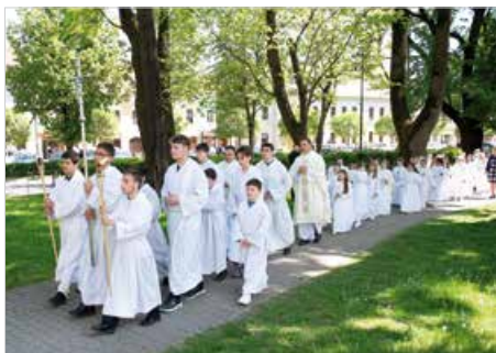
Duchovný otec vedie deti do chrámu.

V dňoch 5. a 12. mája 2024 sa konala v našej farnosti slávnosť 1. sv. prijímania. Už od septembra sa deti na túto slávnosť pripravovali na hodinách náboženstva so svojimi katechétmi, doma s rodičmi i počas detských sv. omší