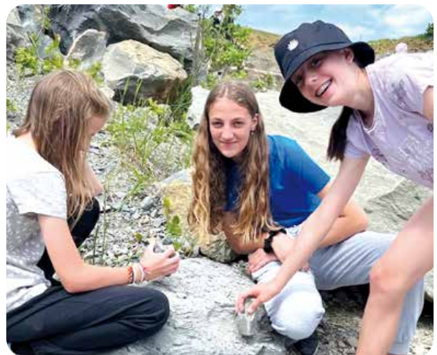
Projektové vyučovanie v kameňolome na Ďurkovci