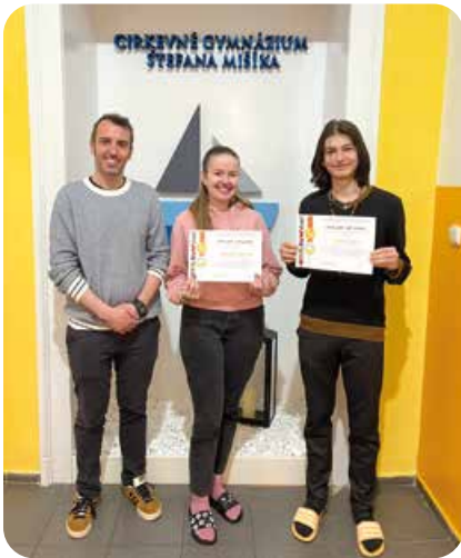
Víťazi súťaže Jazykový kvet