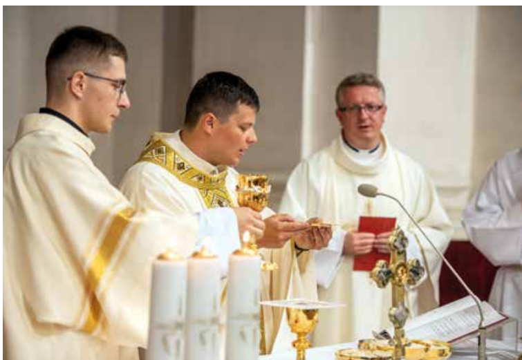
Primičná svätá omša.