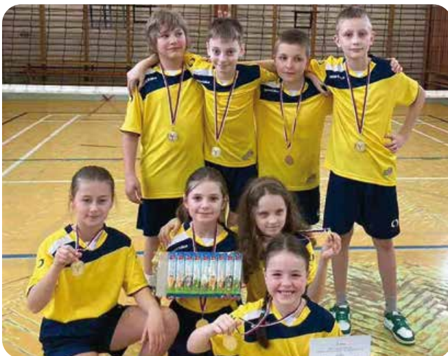
Vítazi v prehadzovanej

Prázdniny sú pred nami a preto prajeme všetkým, vedeniu školy, zamestnancom, žiakom, ich rodinám i našim sympatizantom požehnaný čas strávený v radosťi v kruhu svojich najbližších.