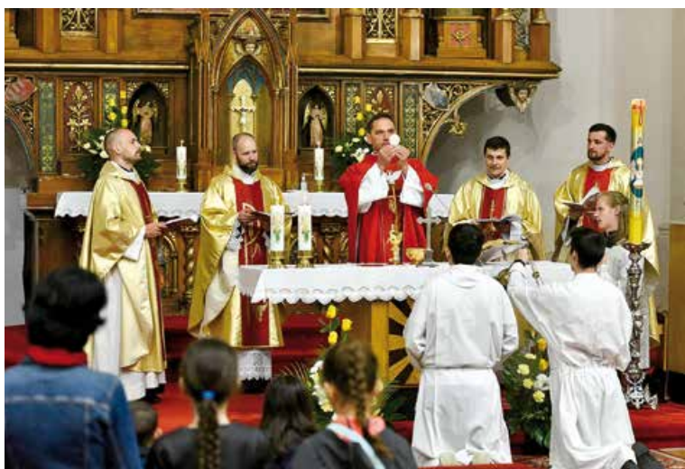
Vigília zoslania Ducha Svätého.