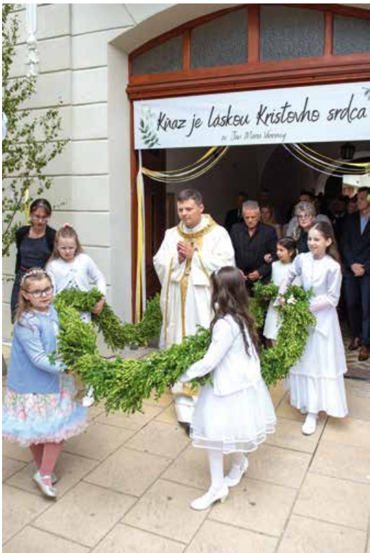
Deti sprevádzajú primicianta.