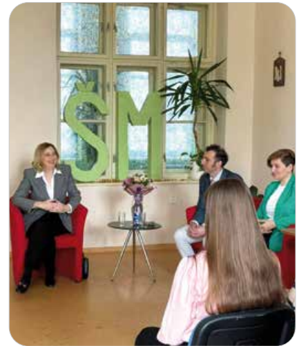
Návšteva talianskej veľvyslankyne v škole

Blížia sa zaslúžené prázdniny, ktoré už pre našich tohtoročných maturantov začali úspešným zložením maturitných skúšok . Tie dopadli veľmi dobre a sme radi, že sme v celoslovenskom meradle dosiahli nadpriemerné výsledky.