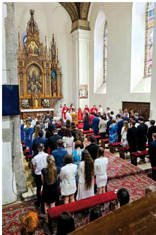
Birmovná slávnosť.