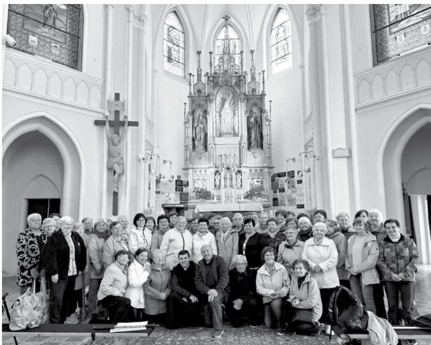
Katolícka jednota na púti v Levoči.

Po kázni sme si obnovili krstné sľuby a vyznali svoju vieru. A keď nastala tá chvíľa, každý z nás bol šťastný, že prijal Pána Ježiša do svojho srdca. Poďakovali sme sa mu spoločnou modlitbou a v závere sme sa poďakovali našim katechetom a pánovi kaplánovi, ktorí nás spolu s barančekom Miškom na túto slávnosť pripravili.