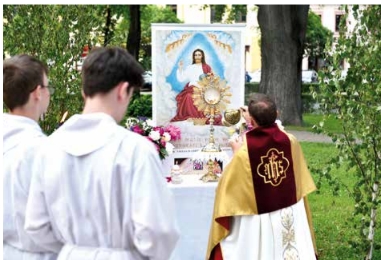
Slávnosť Najsvätejšieho Kristovho Tela a Krvi – Oltárik Rodiny Boha Otca.