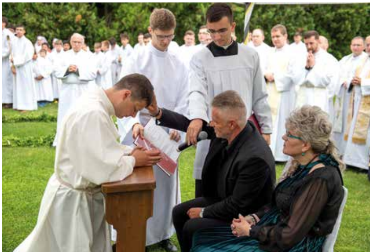
Rodičovské požehnanie.