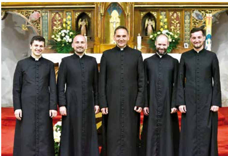
Vigília zoslania Ducha Svätého – kňazi našej farnosti.