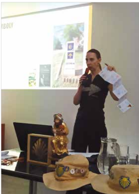
Rozprávanie Jarmily Hricovej o putovaní