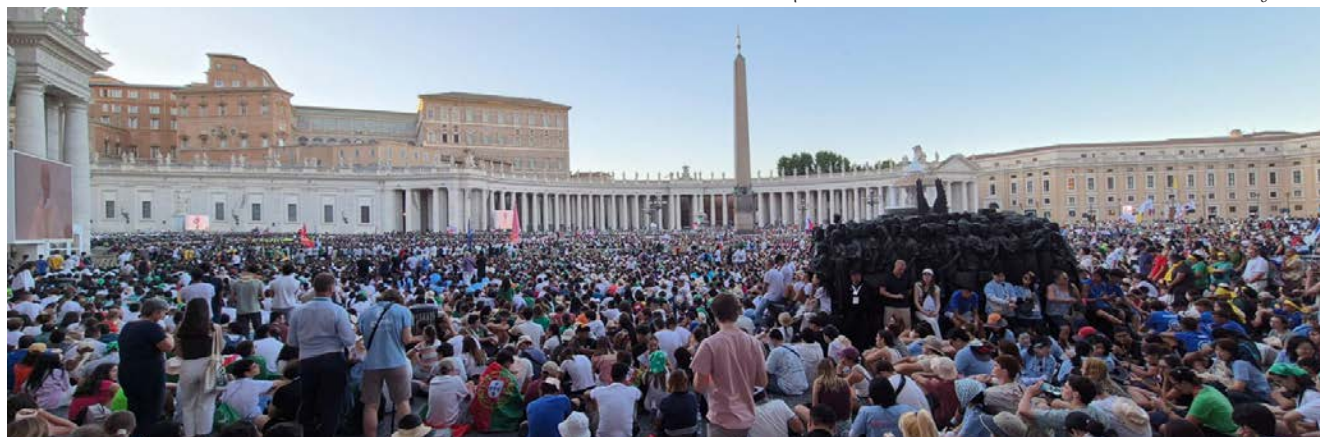
Otváracia svätá omša.