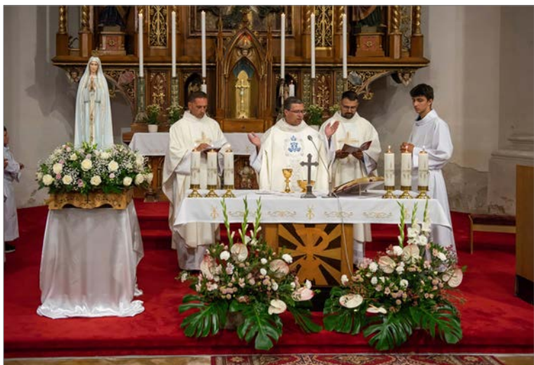
Oslava sviatku Nanebovzatia Panny Márie.