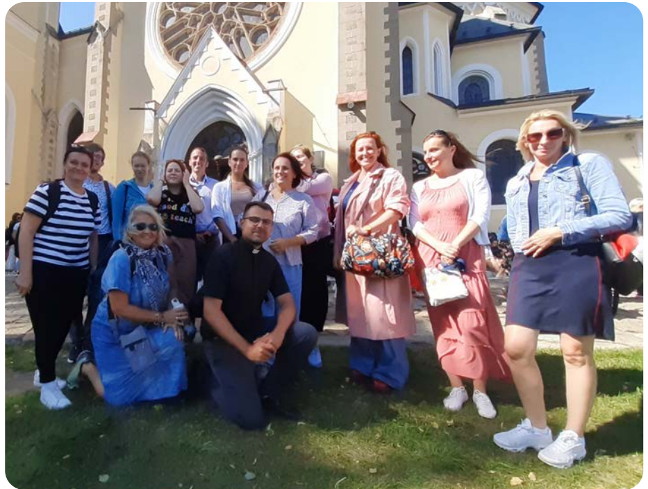
Jubileum učiteľov na Mariánskej hore