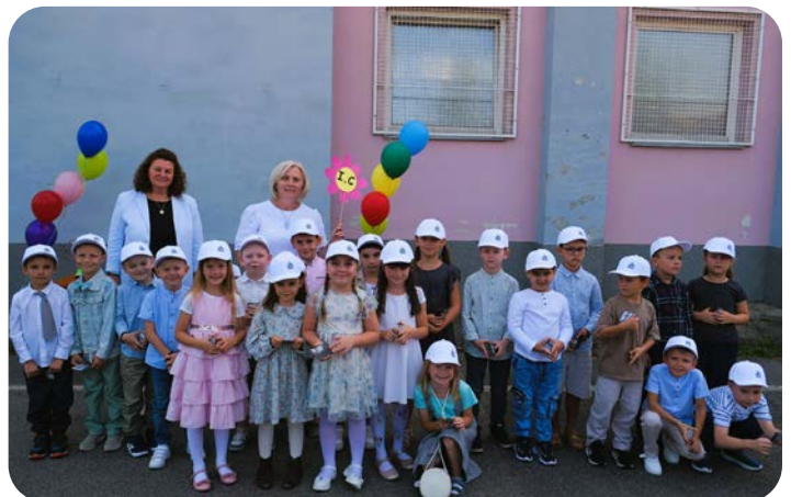
Privítanie prvákov na školskom dvore