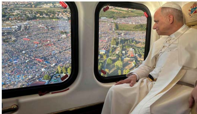
Pápež prilieta.