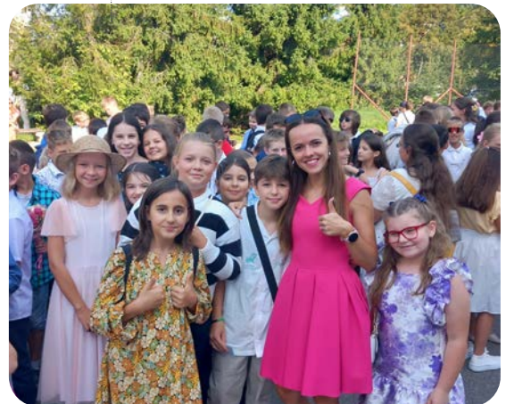
Prvý školský deň