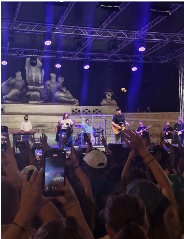
Piazza del Popolo.