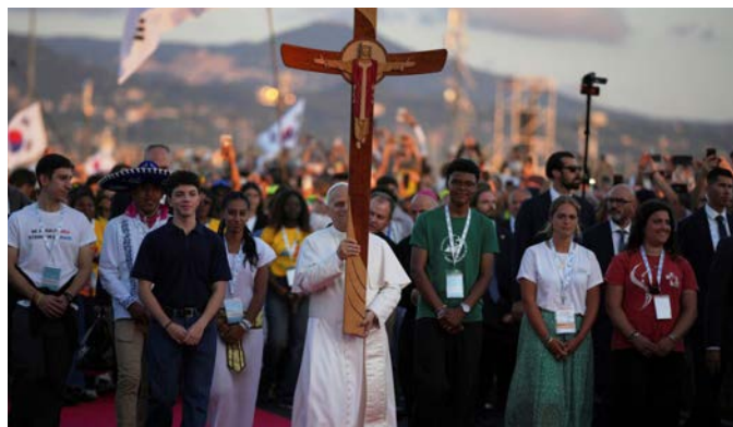
Pápež nesie jubilejný kríž.