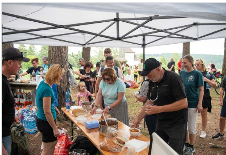
Agapé na letohrádku Sans Souci (Tisícročná kaplnka)