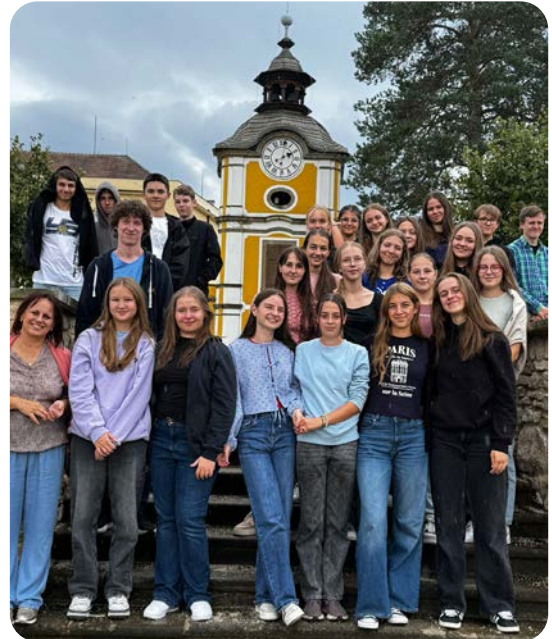
Prváci na duchovnej obnove na Spišskej Kapitule

Aj tento rok nás opäť čaká mnoho aktivít a podujatí, na ktoré sa tešíme, lebo nás všetkých obohacujú a vieme, že aj vďaka nim je naše gymnázium požehnané a cítime sa v ňom ako doma.