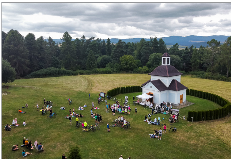
Sv. omša na Sans Souci.