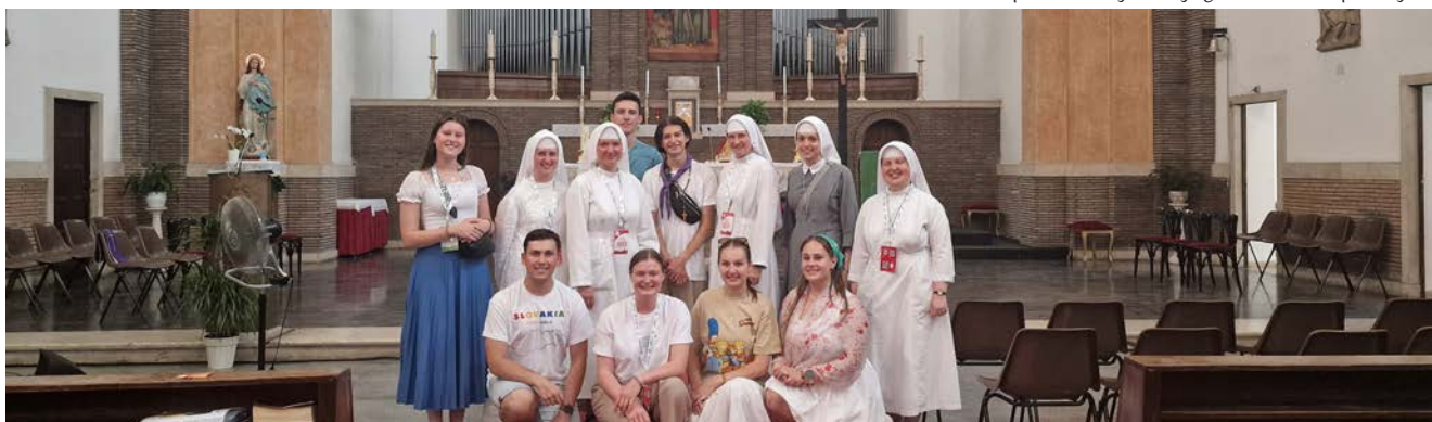
Spišiaci v slovenskom dome.