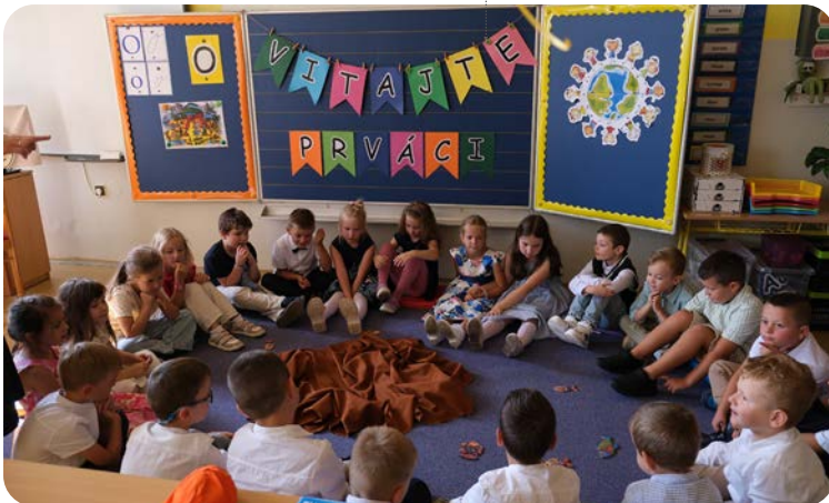
Prváci v triede

Nech nás Duch Svätý vedie počas celého roka.