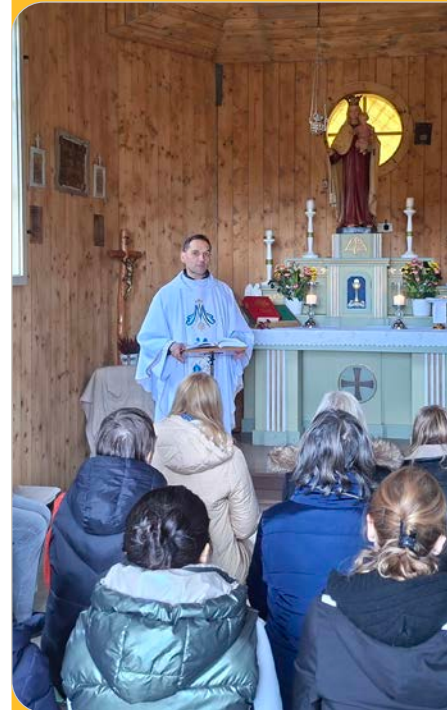
Svätá omša v Schulerlochu

Vďaka spoločenstvu Do Máriinej školy sme mohli aj v tomto roku putovať na spoločné modlitby do Kaplnky Škapuliarskej Panny Márie v Schulerlochu. V sobotu, raz za mesiac, bola možnosť na tomto krásnom mieste, v prírode, prežiť aj spoločnú svätú omšu a vstúpiť do ticha tak, ako Panna Mária, ktorá počúvala Božie slovo a rozjímal o ňom. Ďakujeme tomuto spoločenstvu za ich ochotu a obetu, s ktorou sa starajú o spomínané miesto a vprosujeme im, aby podobne ako Panna Mária mali srdce otvorené a pohotové k službe bližným.