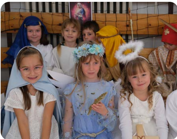
Radosť detí na Sanctyplese