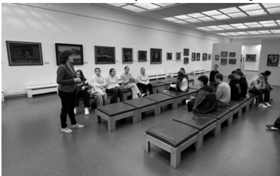
Zážitkové vyučovanie - Liptovský Mikuláš