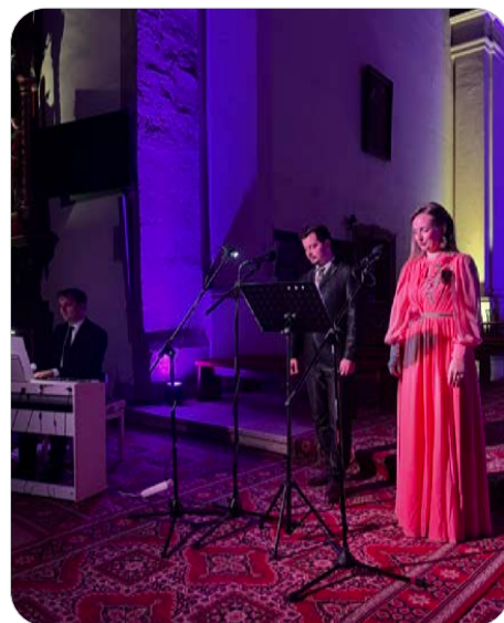
Koncert duchovnej hudby