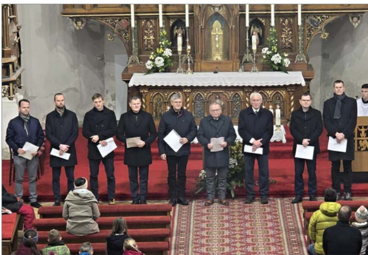
Hospodárska rada farnosti zvolená 9. novembra 2025.