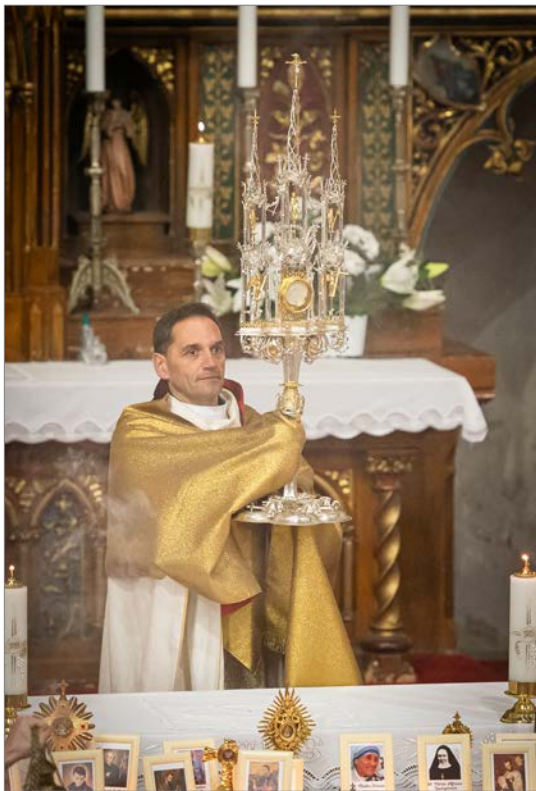
Požehnanie s Eucharistiou.