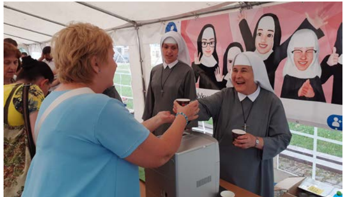
Sr. Stellamaris.