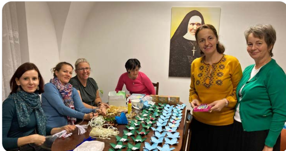
Dobrovoľníčky pri výrobe adventných kalendárov.