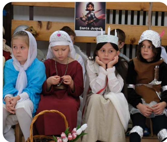
Malí svätci na Sanctyplese