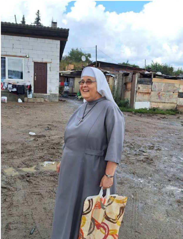
Sr. Stellamaris.