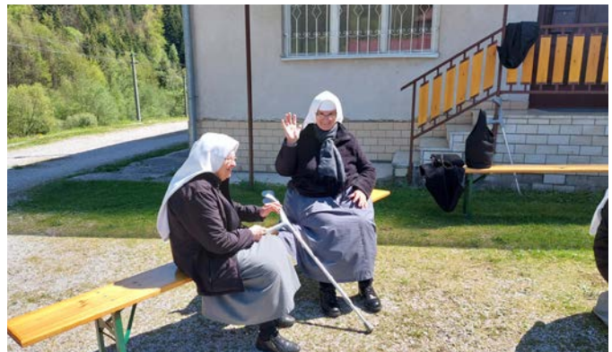
Sr. Mária.