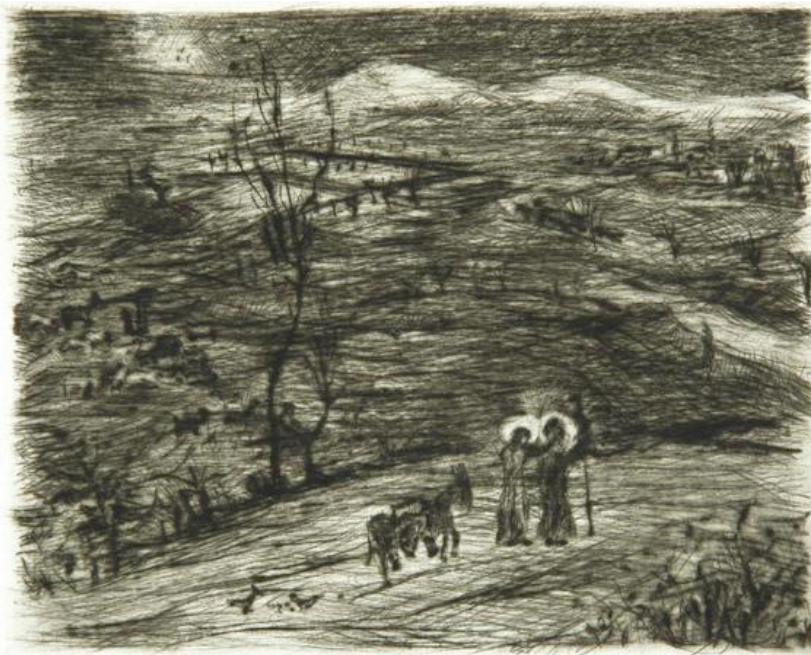
Cesta do Betléma, B. Reynek 1939