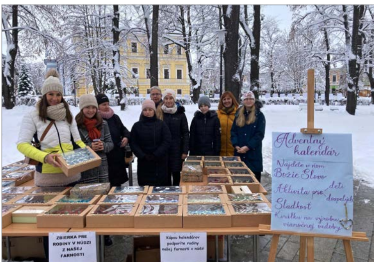
Predaj adventných kalendárov.