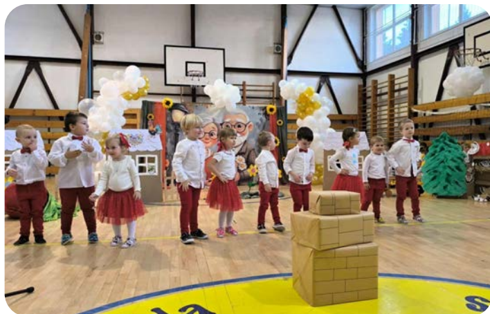
Vystúpenie MŠ pre starých rodičov