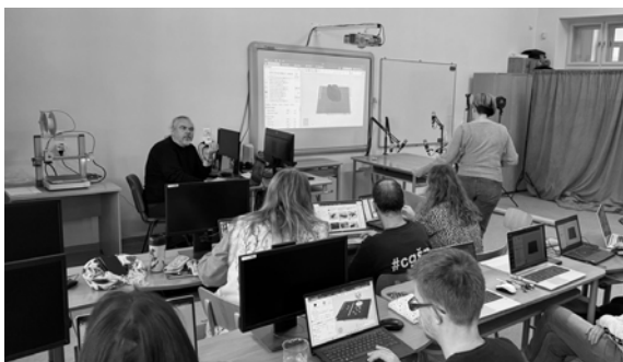
Vzdelávanie našich učiteľov počas jesenných prázdnin