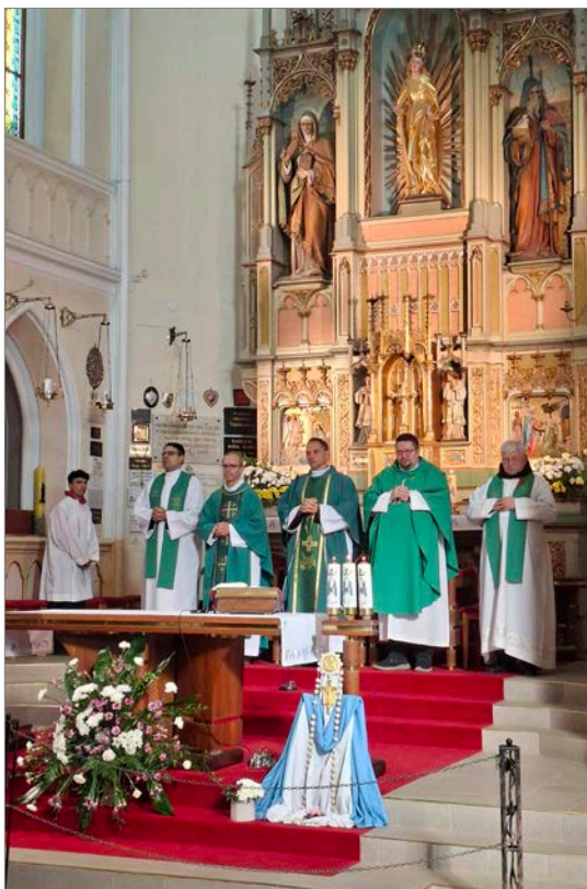
Farská púť na Mariánsku horu.