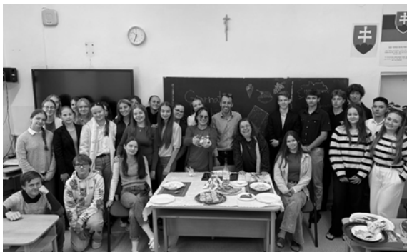
Deň talianskej kultúry